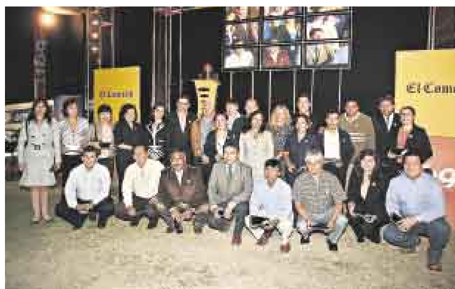
CONFRATERNIDAD. Grupo de compañeros que celebran más de 20 años en el diario.