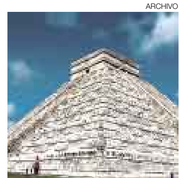
MÉXICO. Líder en el sector turismo