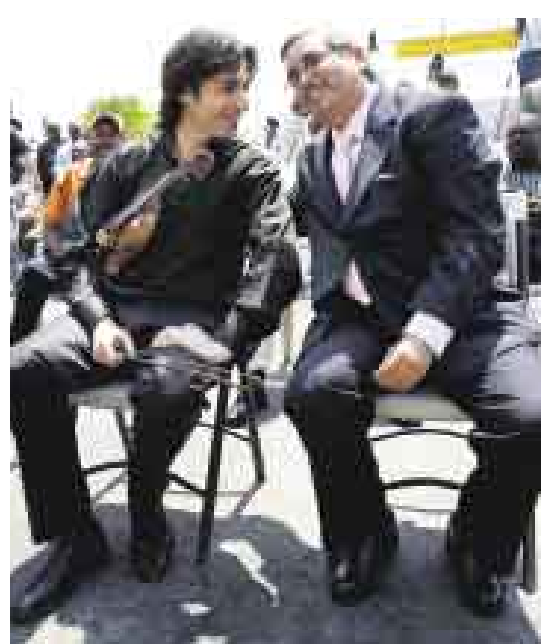
BELLA NOTA. El taxista egipcio Mohamed Khalil encontró en su vehículo el violín olvidado de Quint. El músico le dio 100 dólares, el único dinero que tenía en el momento, pero le ofreció un inolvidable concierto.

■ El reconocido violinista ruso Philippe Quint, quien se ha presentado dos veces en el Perú, ofreció un concierto gratuito ante 50 taxistas de Nueva York, en recompensa por el gesto de un chofer egipcio, quien le devolvió su violín Stradivarius de 1723, valorizado en 4 millones de dólares, que él había dejado olvidado en el vehículo. [B12]