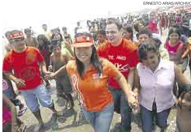
BUSCA. Keiko Fujimori dice que tocará puerta por puerta para ganar adeptos y que su bancada apoyará económicamente la campaña.

Consultada al respecto, la congresista Keiko Fujimori señaló que era muy prematuro