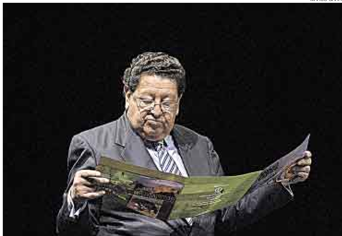
EN BLANCO Y NEGRO. “Ya tenemos el muñeco armado”, dijo ayer Pasco al referirse a la nueva criatura. Reveló que recibía asesoría del BID. El primer ministro Jorge del Castillo indicó que espera se apruebe en esta legislatura.

Pasco precisó que sería un régimen universal básico compatible con las leyes que ya tienen, por ejemplo, los policías, los maestros y los médicos. Por todas estas bondades expresó que no duda en recibir el apoyo del Legislativo.