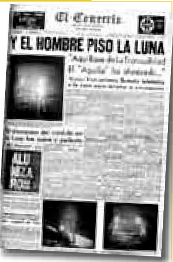
LLEGADA A LA LUNA Lunes 21 de julio (*)