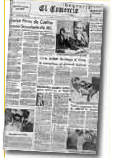
PÉREZ DE CUÉLLAR EN LA ONU Sábado 12 de diciembre (*)