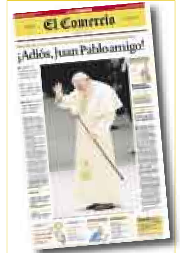
MUERE JUAN PABLO II Domingo 3 de abril (*)