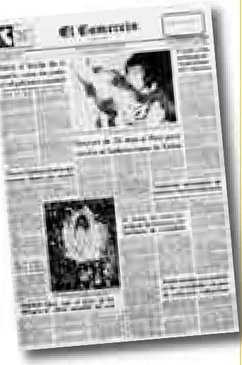
PERÚ CAMPEÓN DE AMÉRICA Miércoles 29 de octubre (*)