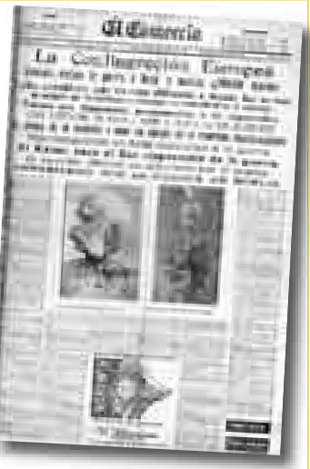
PRIMERA GUERRA MUNDIAL Domingo 2 de agosto (*)