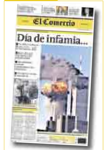
ATAQUE DE AL QAEDA Miércoles 12 de setiembre (*)