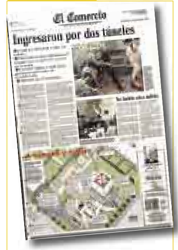
RESCATE DE REHENES Miércoles 23 de abril (*)