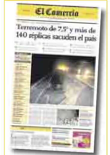
TERREMOTO DE PISCO Jueves 16 de agosto (*)