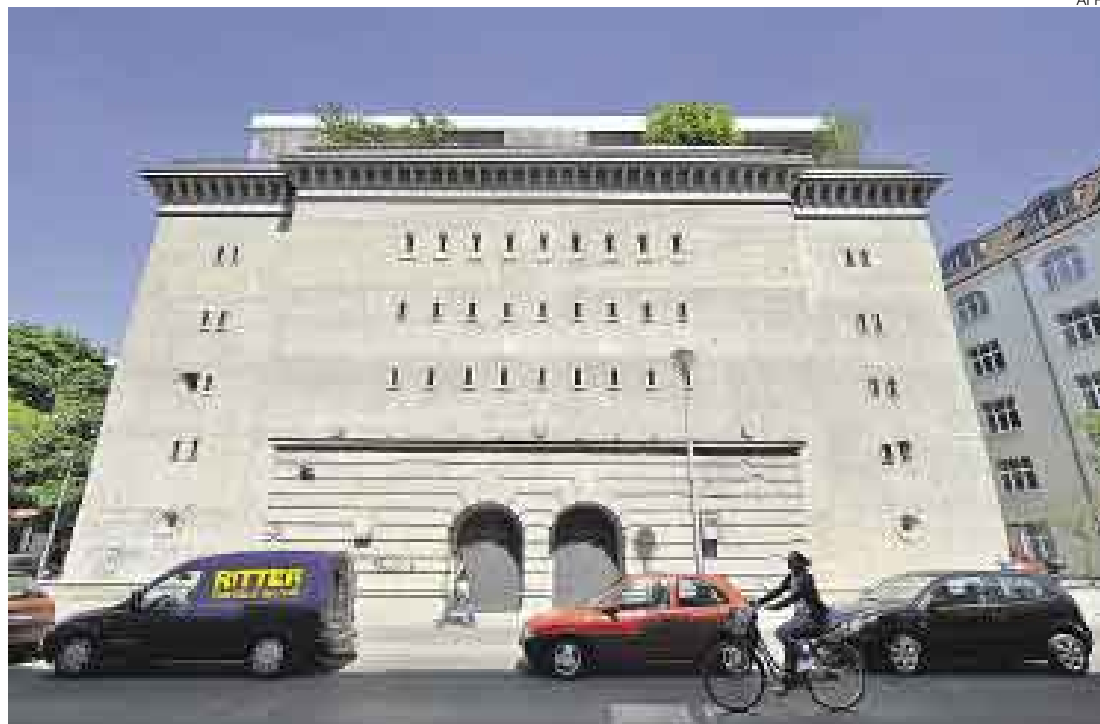
BÚNKER. Vista exterior de la fachada del inmueble, hoy convertido en un concurrido museo.

★ CONSTRUCCIÓN FUE UTILIZADA DURANTE LOS BOMBARDEOS EN LA SEGUNDA GUERRA MUNDIAL, LUEGO SE CONVIRTIÓ EN PRISIÓN Y LUGAR NOCTURNO