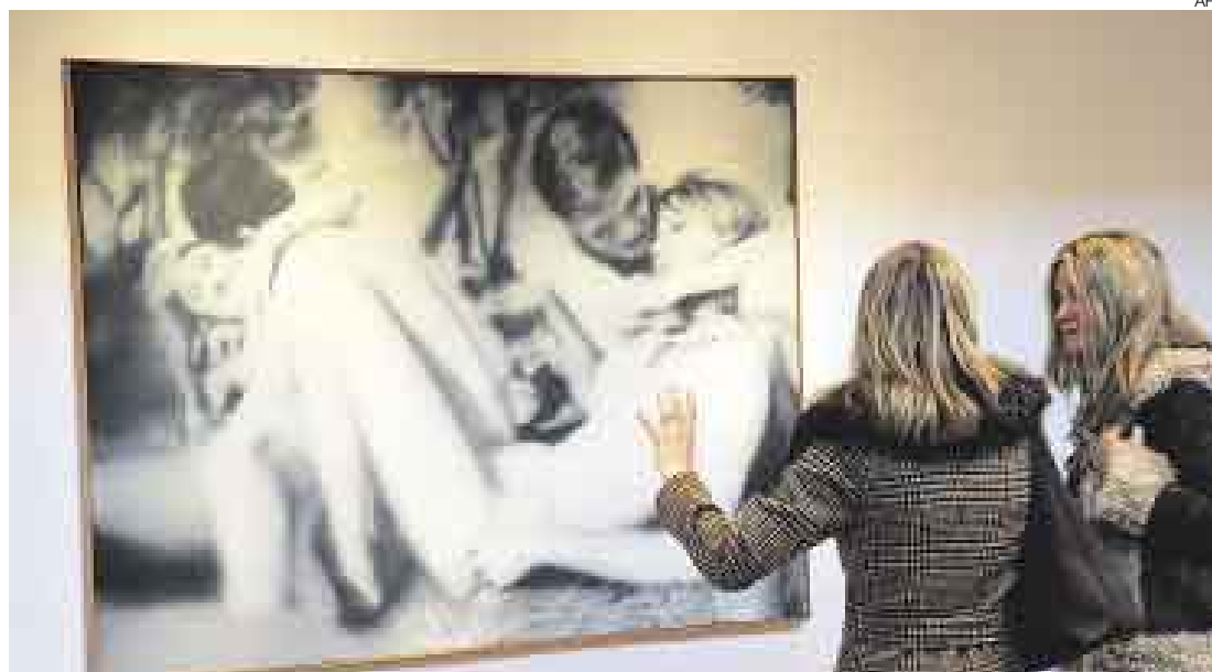
CUADRO. La obra del artista alemán Gerhard Richter podrá ser vista en China a través de dos muestras.