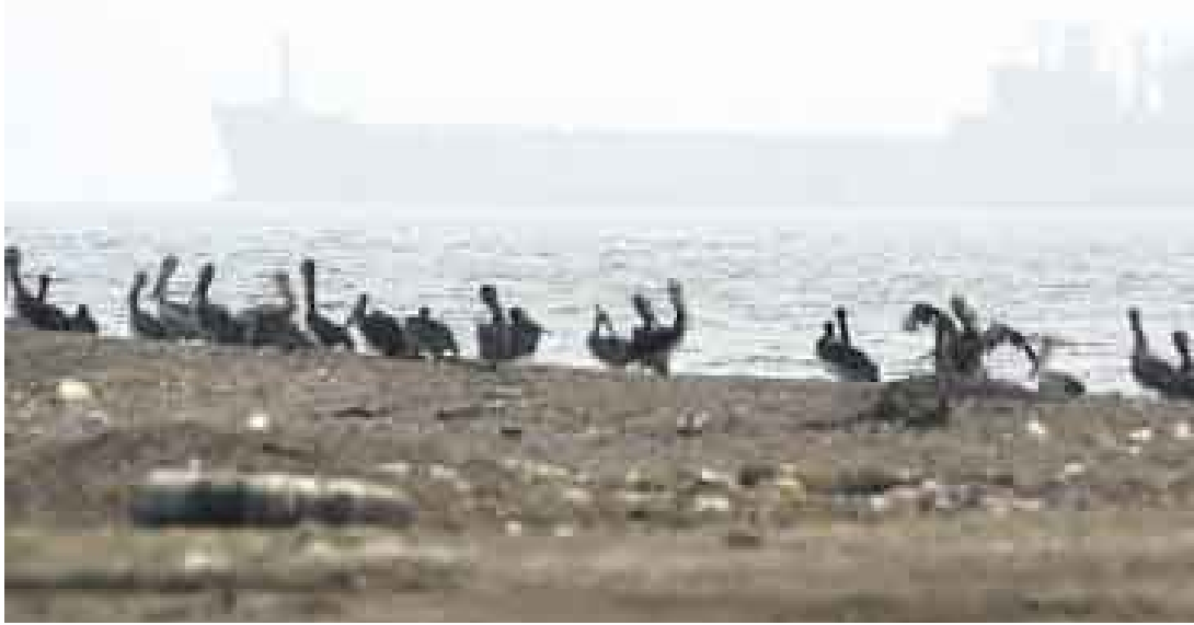
CONTROL. Los pescadores y maricultores de Pisco piden mayor control en las actividades portuarias.

Una especie que ha sido afectada por los restos de petróleo fue el pez luna (similar al lenguado). “Este pez de alta mar, al parecer,