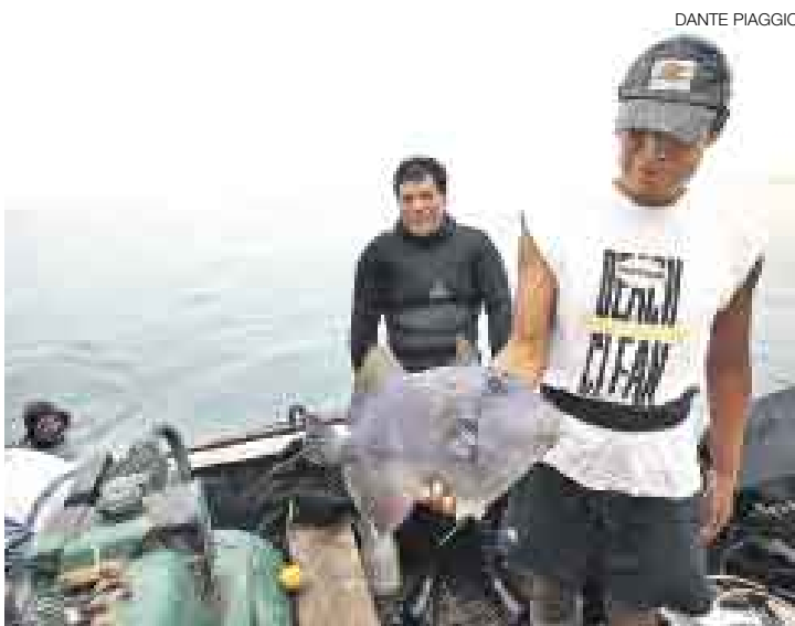
AFECTADOS. Varios ejemplares de pez luna presentaban manchas de grasa, según los pescadores de Pisco.