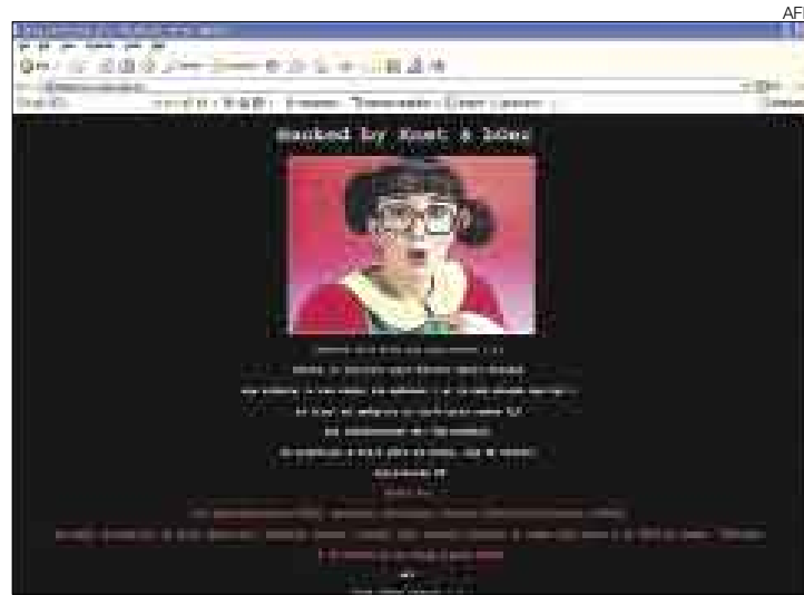
EL CHAVO DEL OCHO. Los piratas pusieron temporalmente en la web del Congreso de México la fotografía de La Chilindrina.

Después de que los encargados del portal del Senado se percataron de la intrusión, la página de la Cámara Alta permaneció fuera de servicio, y durante varias horas no estuvo en funcionamiento. Antes de despedirse los dos atacantes dejaron sus correos electrónicos.