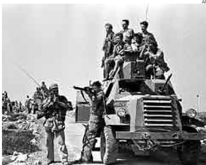
CAMPO DE BATALLA. Las fuerzas israelíes durante mayo de 1948 en Jerusalén. El ejército hebreo es actualmente uno de los mejor equipados.