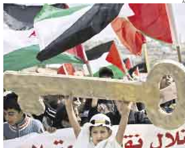
EL OTRO FRENTES. El drama palestino sigue siendo la herida en la creación de Israel. Un conflicto entre ambos pueblos que está lejos de solucionarse.

ciones provocó un resquebrajamiento de la confianza entre ambas partes que desencadenó en la Intifada de Al Aqsa. Los palestinos radicales vinculados a Hamas o la Yihad Islámica ingresaban con facilidad a territorio israelí para inmolarse en medio de centros comerciales, ómnibus, cafés y avenidas, con la finalidad de matar a la mayor cantidad de personas posible. Es en este ambiente de guerra en el que los israelíes creen que al menos, a mediano o corto plazo, será difícil establecer un acuerdo con los palestinos. Ahora, al cumplir 60 años de fundación, el israelí promedio se pregunta qué es lo que ocurrió. “El israelí