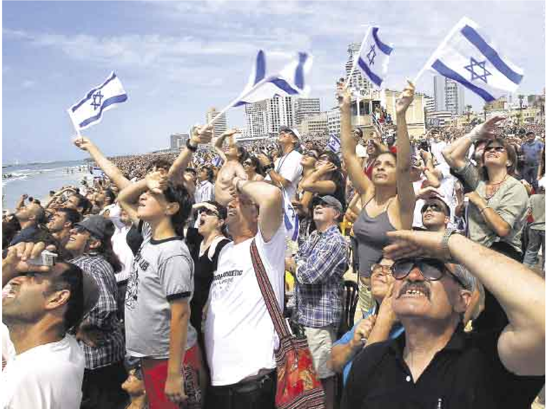
DE CARA AL FUTURO. Israel se creó bajo el ideal de ser un país modelo. Seis décadas y seis guerras después, el país sigue viviendo bajo la amenaza y el odio de sus vecinos árabes.

Así, históricamente el Partido Laborista ha estado más cerca de hacer concesiones con los palestinos, mientras que los derechistas del Likud apuestan por no ceder ante el enemigo pales-