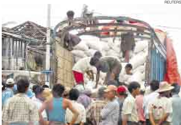
A CARGO. La ayuda alimentaria brindada por las Naciones Unidas está siendo repartida por las fuerzas de la junta militar birmana.

Horas después partían desde Bangkok dos aviones Hércules C-130 de la Fuerza Aérea de Tailandia con ayuda humanitaria de la Cruz Roja de ese país y de una