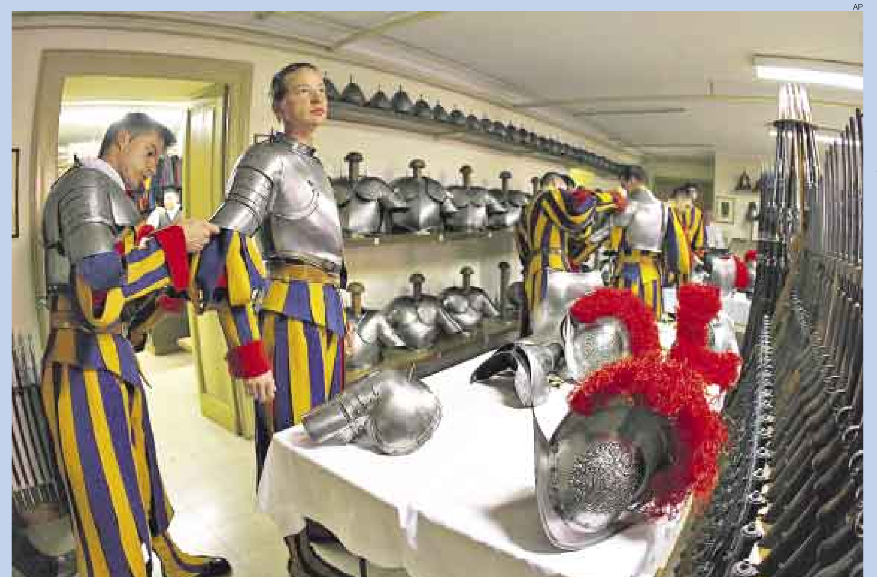
◀ CAMBIO DE GUARDIA. Un efectivo de la tradicional Guardia Suiza del Vaticano prueba sus indumentarias antes de la ceremonia de juramento que se realiza cada 6 de mayo para conmemorar la muerte de 147 oficiales durante un ataque al papa Clemente VII, en 1527. La Guardia Suiza fue creada en 1505 por el papa Julio II.