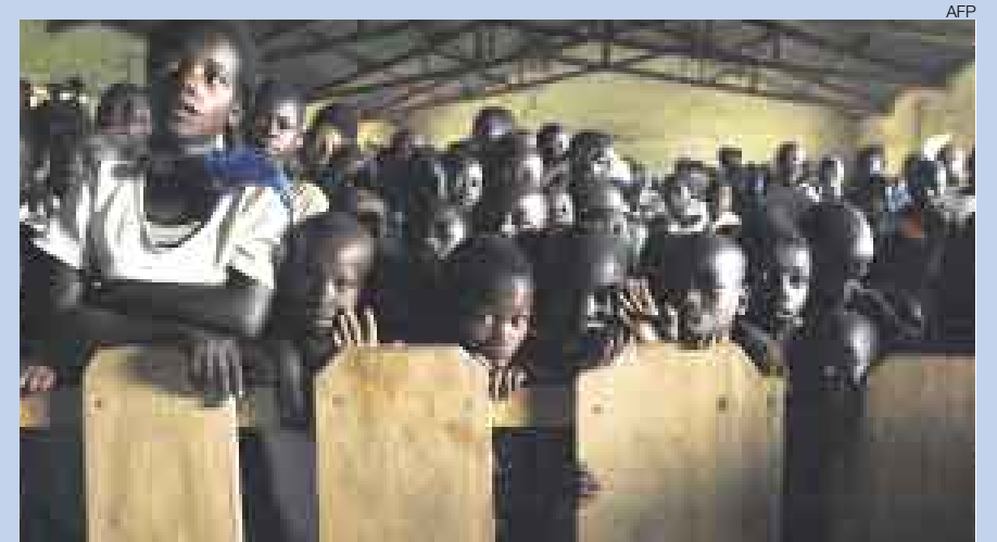
▲ NIÑOS DE LA GUERRA. Decenas de niños ruandeses que huyeron hacia la República Democrática del Congo para escapar de la guerra civil que golpeó Ruanda se reúnen en el pueblo de Kimuwa para ver una película presentada por una agencia de la ONU, que intenta que los rebeldes ruandeses depongan sus armas y que los desplazados vuelvan a sus pais.