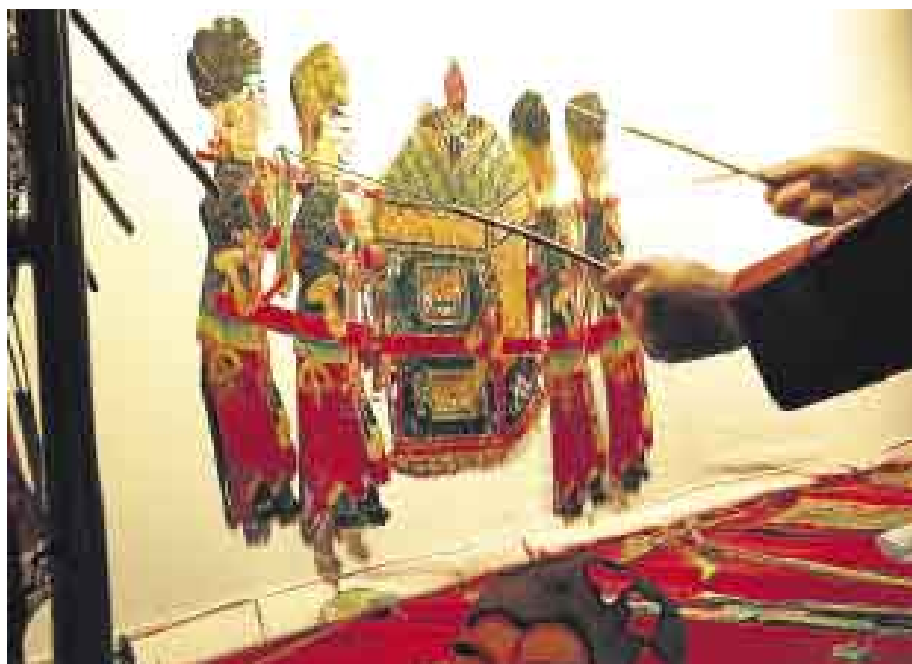
TÉCNICA. Cada personaje está formado por 11 partes unidas con hilos y tres varillas que sirven para realizar los movimientos. Las figuras se elaboran con cuero de buey, burro o cordero.