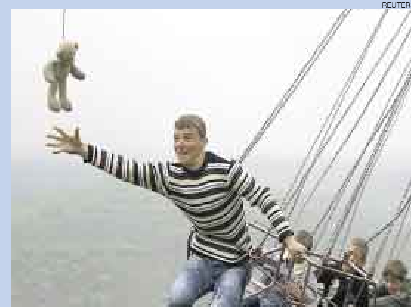
◀ AGARRA AL OSO. Un joven de la etnia gorani se divierte tratando de atrapar a un oso de peluche mientras da vueltas en un carrusel. El curioso juego es parte de una celebración en el pueblo de Vranic, ubicado cerca de la frontera de Kosovo y Macedonia.