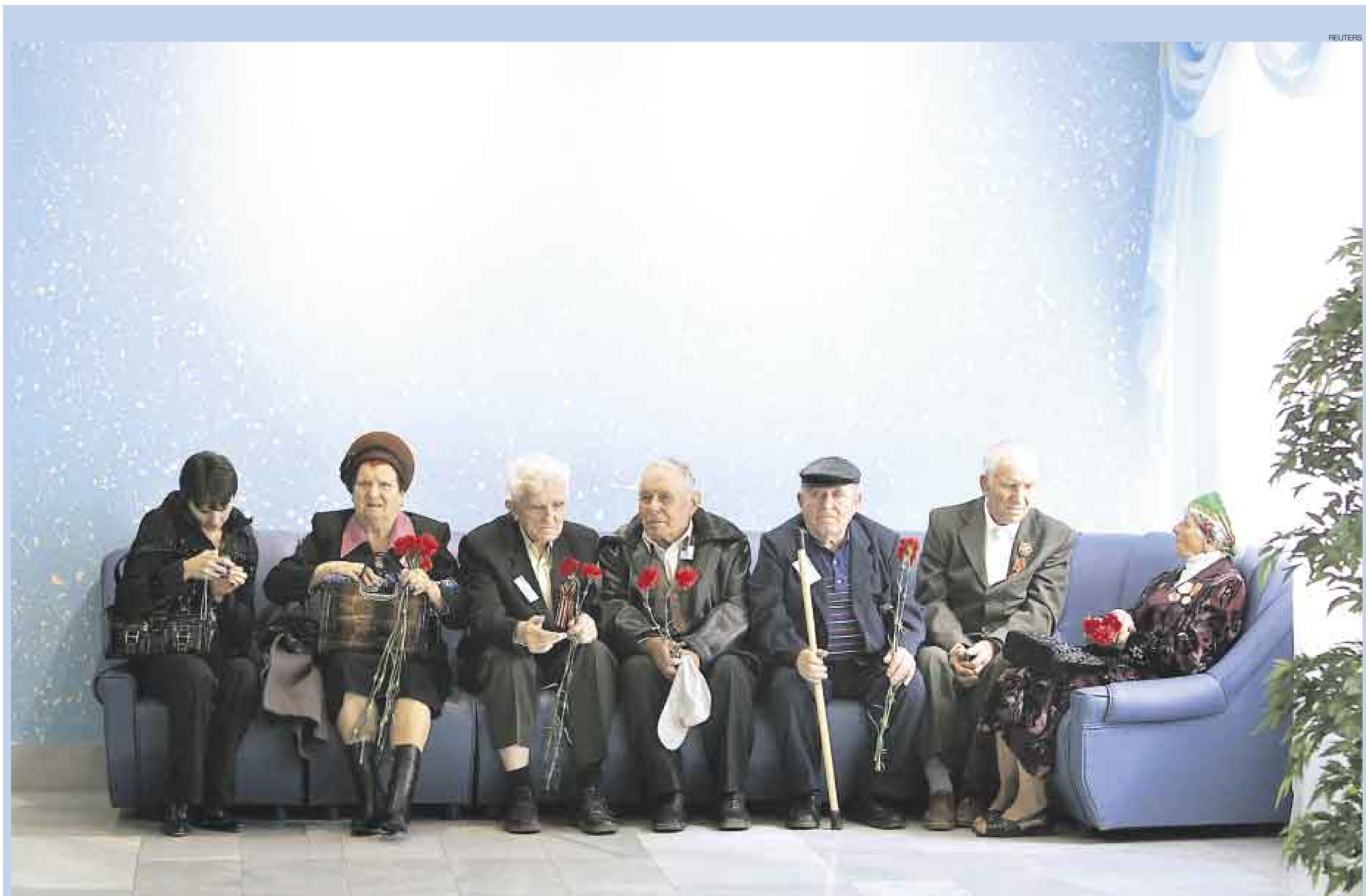
▲ HOMBRES DE GUERRA Y PAZ. Con motivo de conmemorarse un año más de la derrota alemana en la Segunda Guerra Mundial, el Gobierno Ruso realizó un homenaje para sus veteranos en la ciudad de Stavropol (al sur del país), al que asistieron seis militares en retiro, quienes fueron testigos de excepción del conflicto que cobró la vida de 60 millones de personas, incluidos 78.000 efectivos rusos que participaron en la toma de Berlín.

HUELLAS DEL TIEMPO. La experiencia y la tradición se dieron cita esta semana en diferentes partes del mundo para entregarnos entrañables y conmovedoras imágenes que esta vez comparten tribuna con los interminables dramas que golpean África y Asia.