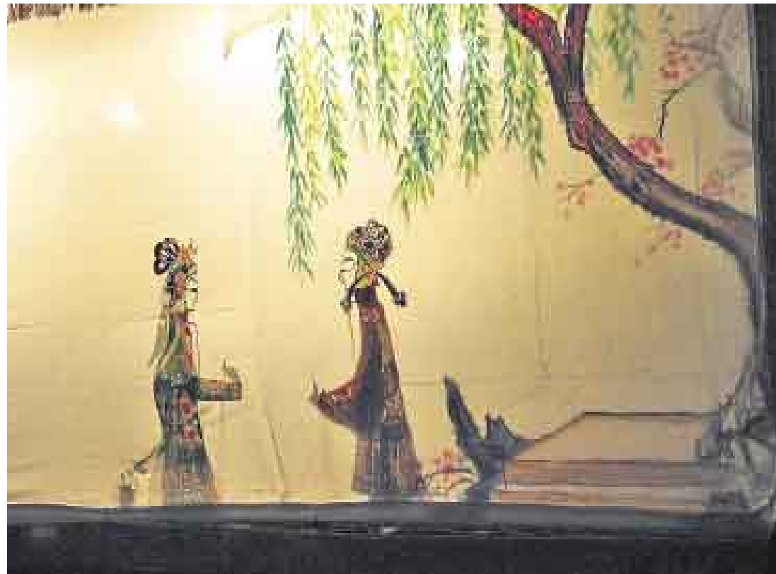
TRAS EL VELO. Delante de la cortina se proyectan las coloridas sombras. Una luz encendida atrás da el efecto.