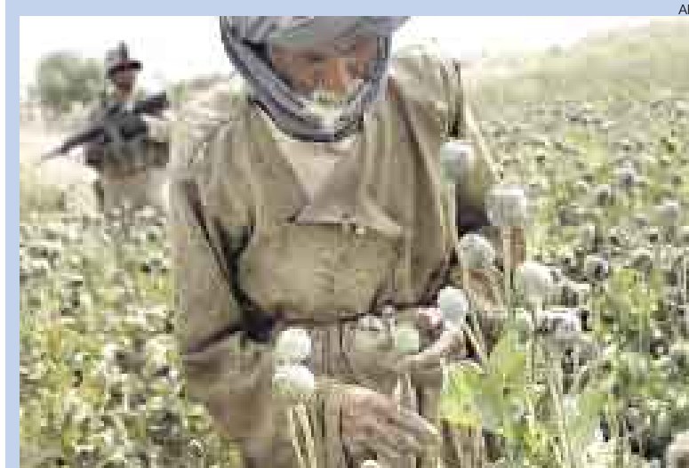
▲ EL MISMO LASTRE. Pese a la presencia de miles de soldados extranjeros en Afganistán, este país sigue siendo un importante productor de opio. La imagen demuestra la pasividad de los soldados ante el cultivo de la amapola.