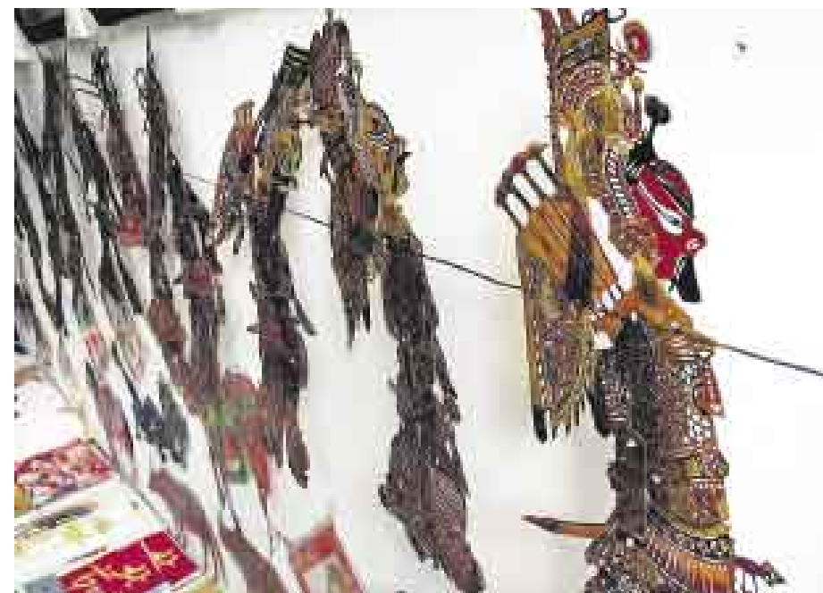
TRADICIÓN. En la década del 50, la mayoría de pueblos chinos tenía una compañía de sombras. Amenizaban desde bodas hasta funerales y rendían culto a los dioses.