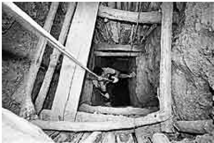
CON DINAMITA. Los socavones informales son abiertos a punta de dinamita, la que utilizan sin mayor control y cuidado.

Pero en casi todas las demás concesiones la imagen se repite: unos hombres columpiándose en timbaletes y otros metidos en socavones de hasta 50 metros de profundidad que solo salen a la superficie para almorzar o para dormir en campamentos improvisados, siempre con el riesgo de ser atacados por la macanera, una culebra de la zona que sale a cazar en mayo, cuando terminan las lluvias. ■