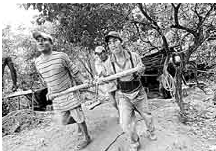
FORÁNEOS. Muchos de los mineros son foráneos. Proviene de ciudades de la costa y llegan a Ayabaca atraídos por el oro.