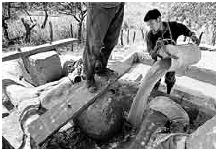
DESCUIDO. Los mineros informales manejan productos peligrosos y tóxicos, como el mercurio y cianuro, sin ningún tipo de protección.

La provincia piurana de Ayabaca es el centro de operaciones de miles de mineros informales y artesanales que explotan a su manera el oro que yace bajo la superficie