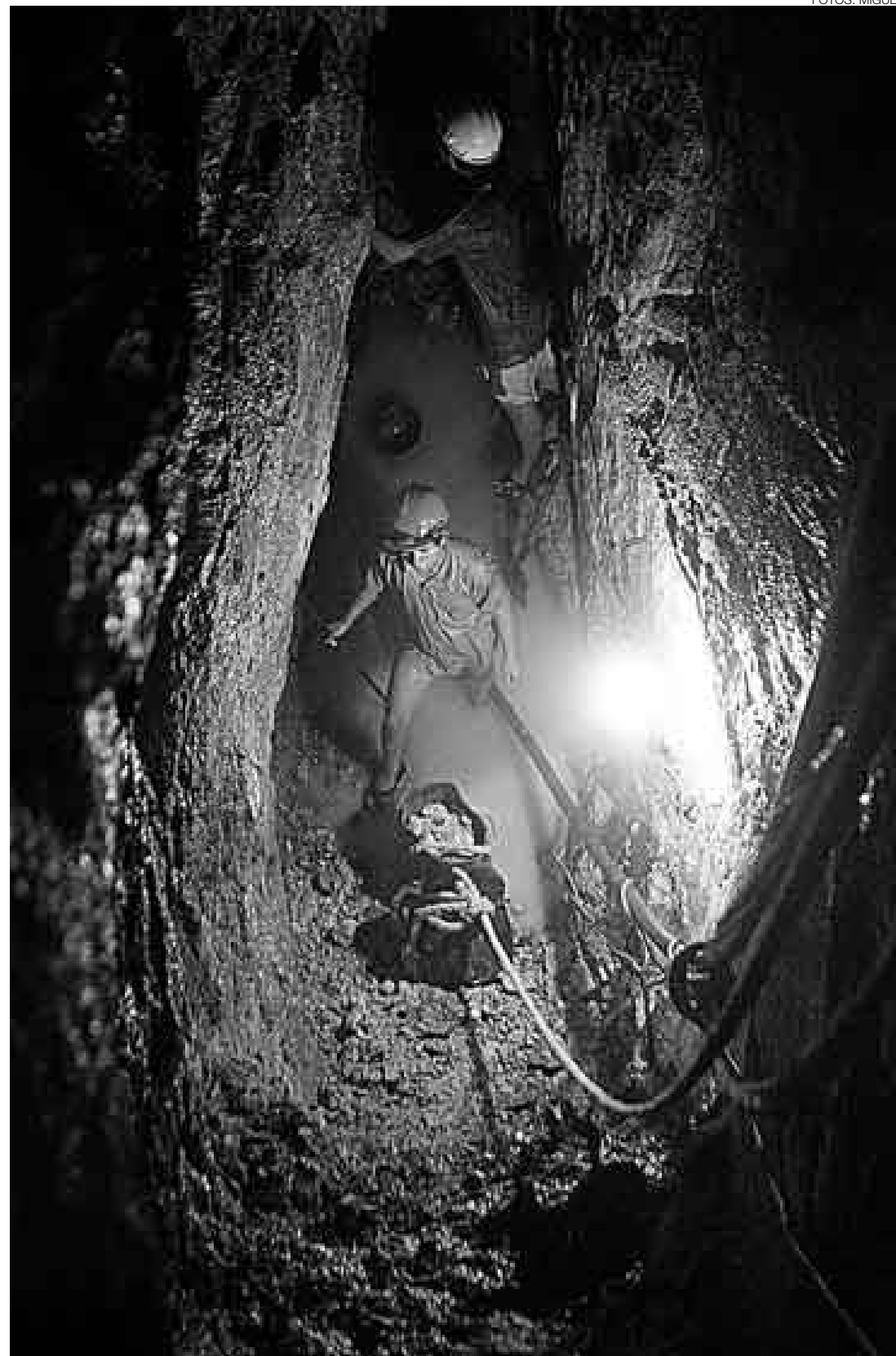
TODO DEPENDE DE UNA CUERDA. En busca del oro, los mineros informales descienden varios metros de altura, sin ayuda de escaleras o andamios. Su vida pende de una cuerda. Ellos trabajan desprovistos de botas y guantes.