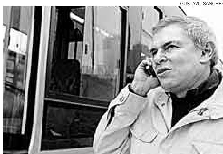
POCO A POCO. El alcalde de Lima, Luis Castañeda, sigue gozando de una alta aprobación, pero paulatinamente esta va disminuyendo.