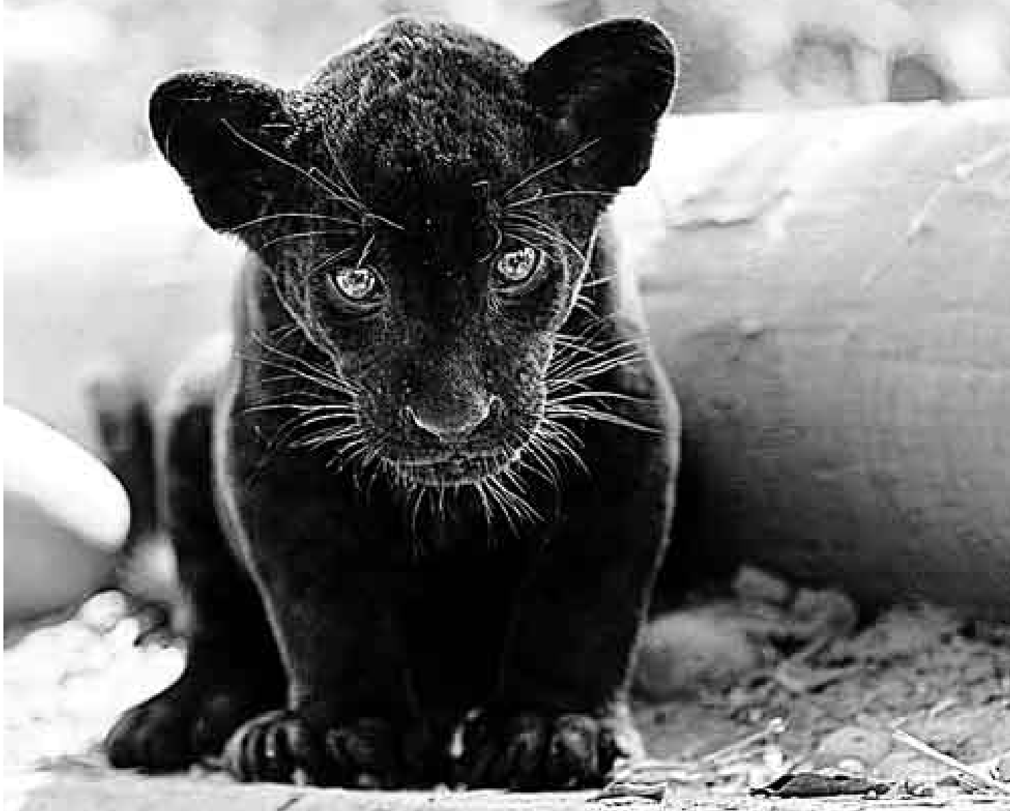
LA EDAD DE LA INOCENCIA. El último otorongo peruano nació hace un mes y medio. Y no precisamente en el hemiciclo. Aún no tiene nombre.