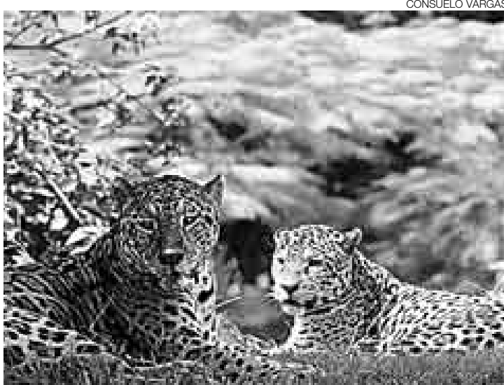
CASI UNA POSTAL. Esta pareja de otorongos adultos reposa sin inmutarse. Todo un ejemplo de calma para los otorongos de saco y corbata.