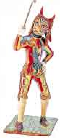
SANTIAGO ROJAS. Los bailarines del carnaval de Paucartambo y las máscaras: piezas irrepetibles.