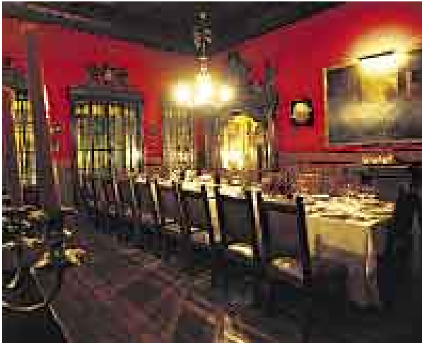
LUJO. Desde 1535, la Casa Aliaga es un recinto inigualable.