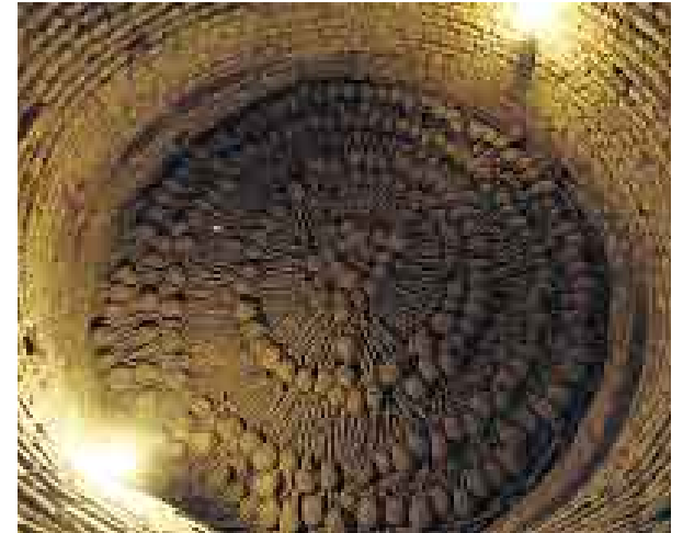
OSCURO TOUR. Catacumbas de San Francisco: imperdible.

uno puede observar con detenimiento la Catedral de Lima, y su entrada con tres puertas. A pesar de sus numerosas reconstrucciones, la basílica sigue guardando la misma ubicación desde 1535.