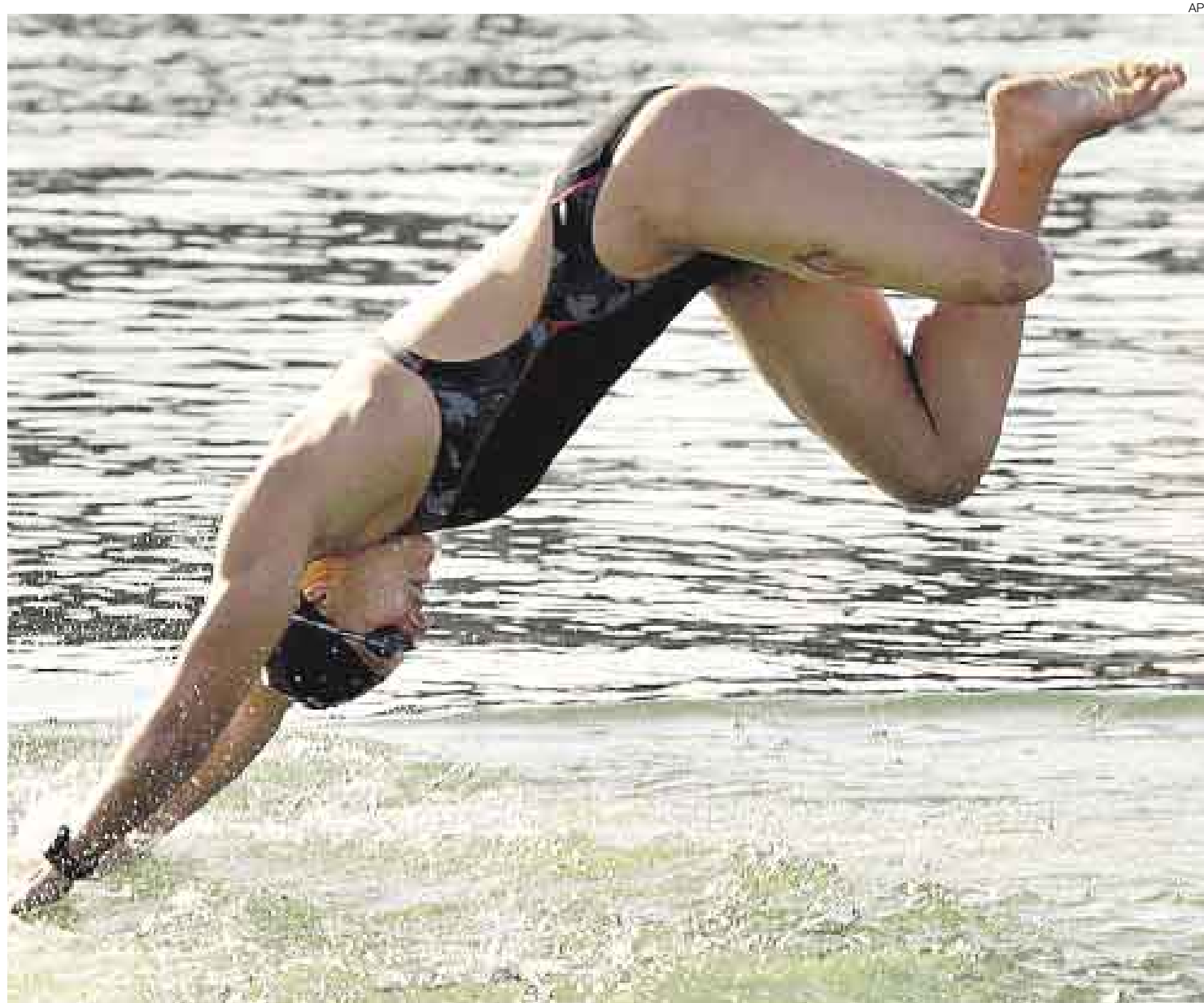
ADAPTACIÓN. Natalie du Toit solo se impulsa con su pierna derecha en el agua y ha fortalecido los brazos y hombros. Ha tenido éxito.

Hasta donde se conoce, es la primera vez que un atleta, hombre o mujer, al que le falta un miembro clasifica a unos juegos olímpicos. En Sidney 2000 la estadounidense Marla Runyan compitió en la final de los 1.500 metros planos pese a que no veía nada con su ojo derecho y su ojo izquierdo solo funcionaba al 10%. Pero ella había tenido problemas de la vista desde su na-