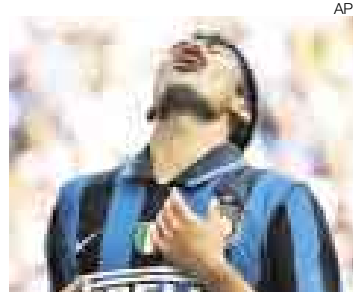
A UNA FECHA. Tiene un punto de ventaja sobre la Roma.

El Inter empató el domingo 2-2 con el Siena en su estadio y ahora solo tiene un punto de ventaja sobre la Roma, a la que hace dos semanas superaba por seis de ca-