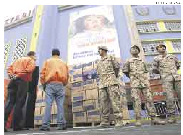
AYUDA ES BIENVENIDA. Puede llevar al Estadio Nacional mantas, chalinás, ropa gruesa, abrigos, gorros, medias, zapatillas o calzado con suela de goma.