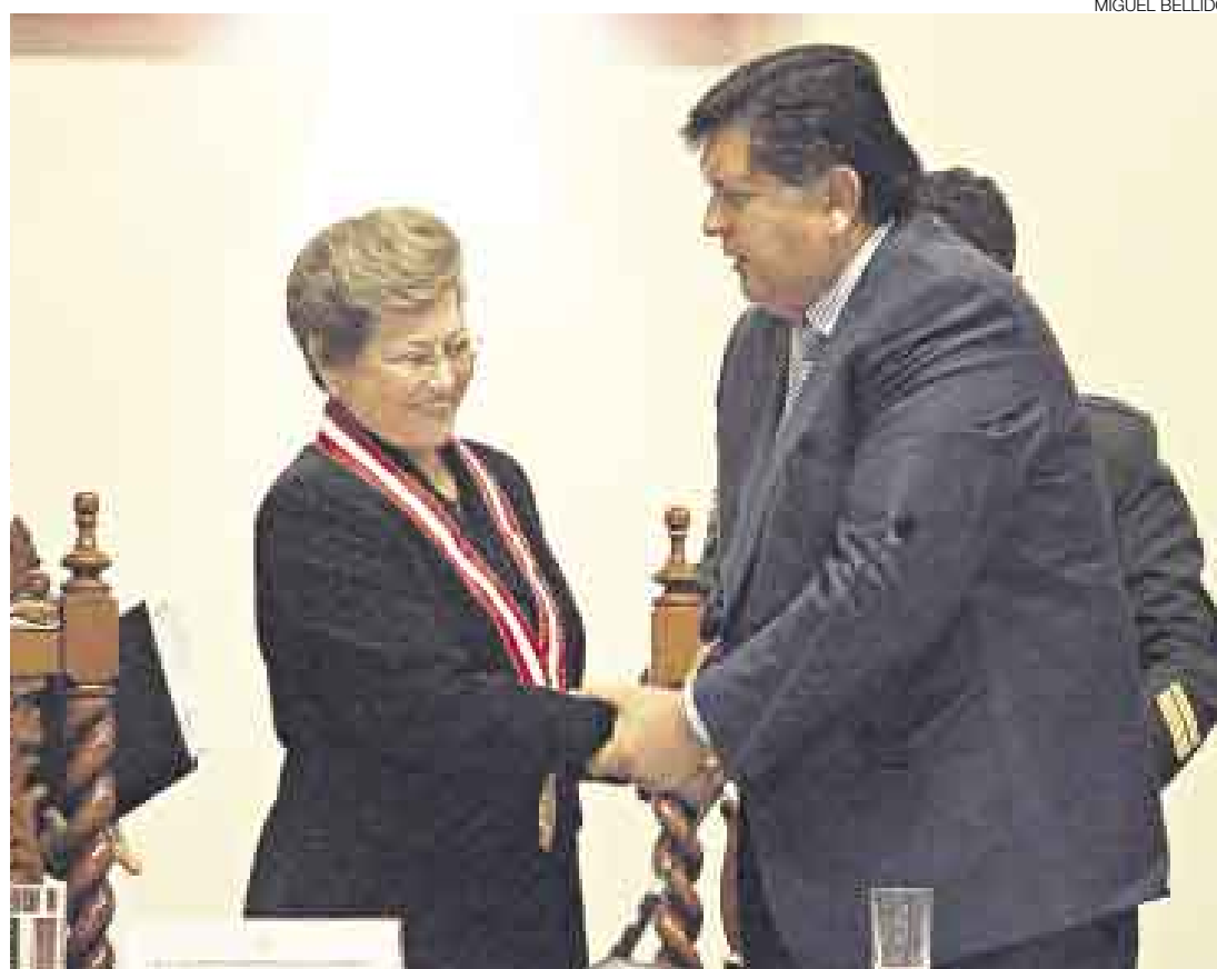
SALUDO. Alan García prometió respetar y hacer respetar el criterio del Ministerio Público liderado por Gladys Echaíz.

“Si alguien no está de acuerdo que lo diga, ya que la ley permite la voluntad de expresión, libre, clara y plena. Si no está de acuerdo, que presente una denuncia y formule su recurso de amparo, pero que