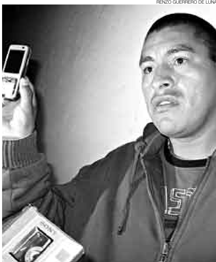
CLAVE. Llamadas hechas desde este celular comprometen al 'Sinchí'.

que intenté escapar al enterarme del hecho. Todo eso es mentira. Sigo aquí y entrenando con mis compañeros. Si me molesta que salgan publicaciones culpándome; pido que tengan más respeto por mí y por mi familia", dijo.