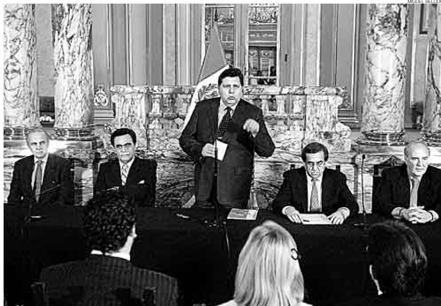
UN FONDO. Al crear el Ministerio del Ambiente, García anunció que planteará en la V Cumbre ALC-UE la formación de un fondo de reforestación.

También es una organización adscrita al Ministerio del Am-