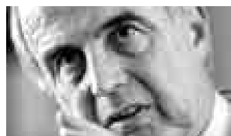
ISMAEL BENAVIDES MINISTRO DE AGRICULTURA

“ La deficiencia principal en la creación de este nuevo ministerio es la falta de debate sobre sus objetivos y funciones. No se han recogido otras propuestas y solo ha tenido acceso al proyecto del Poder Ejecutivo un círculo muy pequeño”.