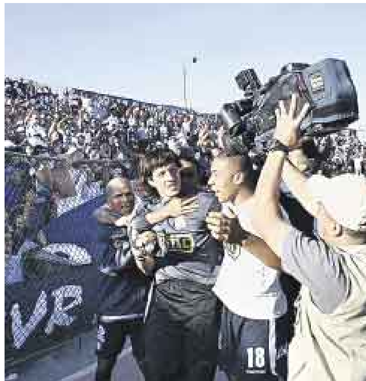
VILLANO. Bologna casi se lía a golpes con Ferrari. Falló en el gol.