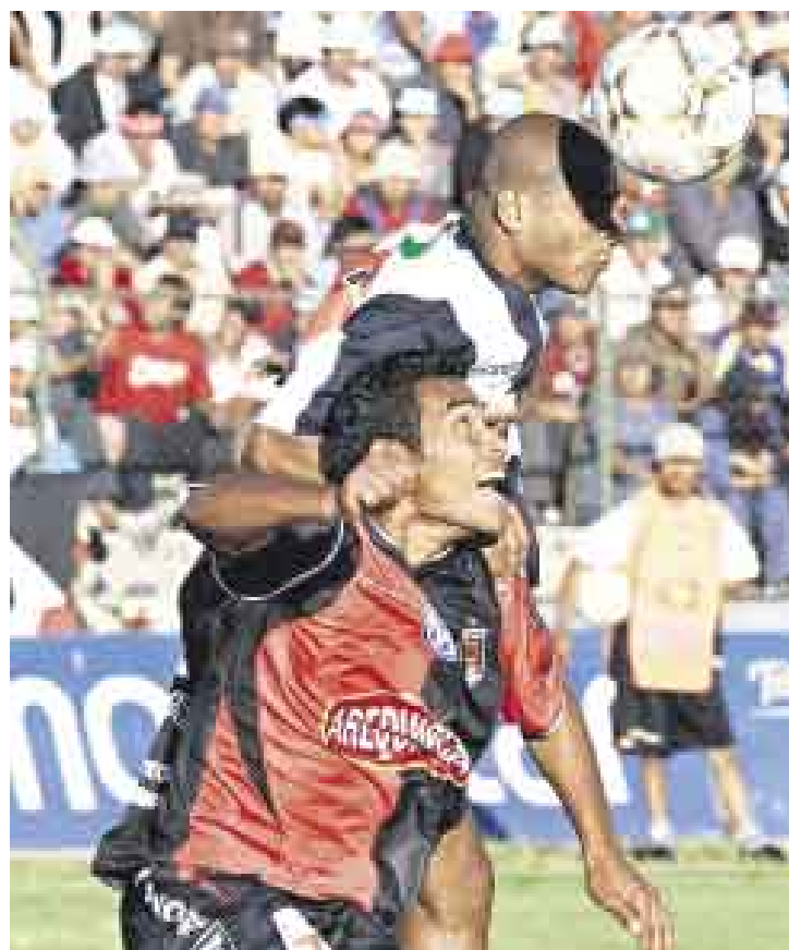
FLOJO. Aguirre tuvo su peor partido desde que volvió al Alianza.