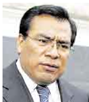
VELÁSQUEZ. Sería la carta del Apra para mantener la presidencia.

se ha tocado el tema a fondo, ambos coincidieron en que en esta oportunidad la oposición debería tener la presidencia.