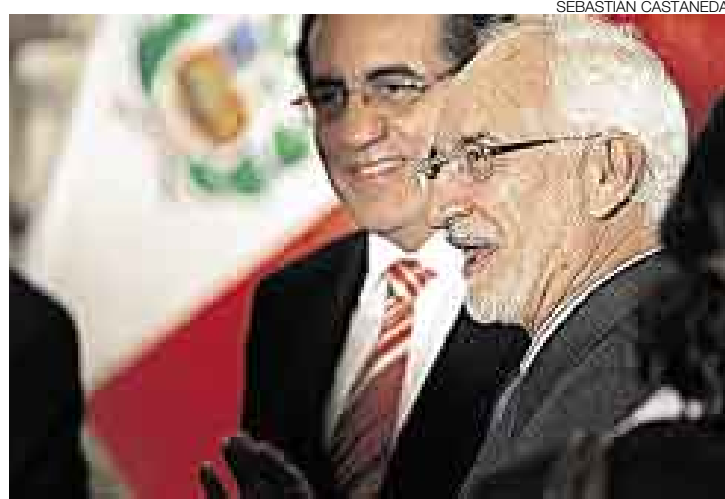
SEÑOR MINISTRO. Antonio Brack encabezó el grupo técnico que diseñó uno de los borradores que creó el Ministerio del Ambiente.

“Estoy honrado de que el señor Antonio Brack haya aceptado ser ministro y tendrá todo mi respaldo y apoyo, para hacer lo que deba hacerse en defensa del medio ambiente”, dijo en Palacio de Gobierno, durante una conferencia conjunta con la canciller alemana, Angela Merkel, a quien comprometió para que el Ministerio del Medio Ambiente de su país colaborara con el desarrollo y la for-