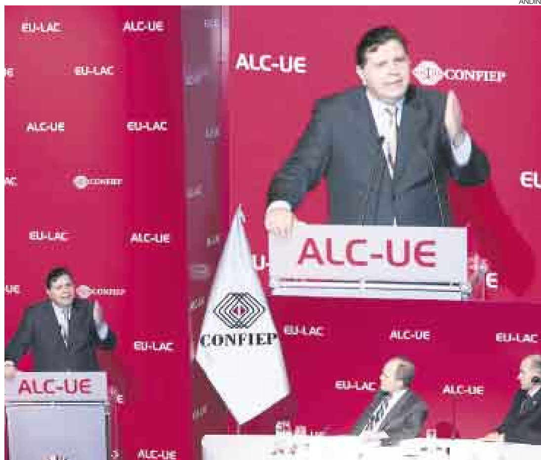
CONSOLIDACIÓN. Ante los empresarios latinoamericanos y europeos, el presidente Alan García expuso el panorama de crecimiento de la economía peruana y las posibilidades de inversión que esta ofrece.

La posición del Perú y Colombia es distinta de la de Bolivia y Ecuador. El presidente Alan García se refirió a este hecho en su discurso de inauguración de la II Cumbre Empresarial al decir: “Nosotros quisiéramos correr hacia un TLC con la UE, pero no nos dejan; tenemos una bola de hierro en el tobillo”. Además, le pidió al representante de la UE que se encontraba en el panel: “La UE nos trae el mensaje de la unión y, por eso, le rogamos que nos deje unirse a Europa, pues francamente a veces la UE nos pone condiciones que parecen imposibles”.