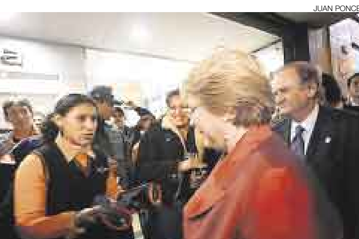
CON LA GENTE. La mandataria no dudó en acercarse a las personas que la saludaron en el Jirón de la Unión, frente a la Casa O'Higgins.

pleja y profunda y tendrá que seguirse trabajando por la vía de mirar los desafíos que tenemos en común. Tenemos pueblos con los mismos sueños y anhelos, y compartimos la mirada del Pacífico hacia el Asia", manifestó la presidenta en un breve discurso en el que no hubo opción de preguntas de la prensa nacional y extranjera, y que básicamente se centró en la restauración de la Casa O'Higgins.