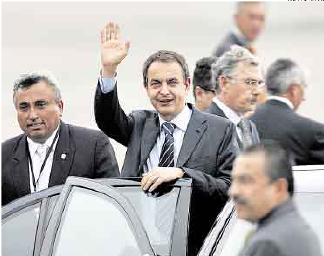
APOYO. El presidente del Gobierno Español, José Luis Rodríguez Zapatero, anunció la visita del rey Juan Carlos de España para los días 27 y 28 de octubre y la firma de un acuerdo de ayuda en el tema de agua.