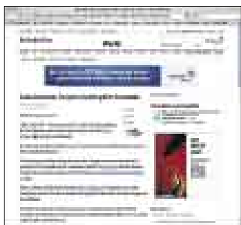
EE.UU. “The New York Times”.

El diario estadounidense “The New York Times” (nytimes.com) dio cuenta sobre el encuentro de líderes europeos y latinoamericanos. Enfatizó la presencia de los presidentes Álvaro Uribe de Colombia, Hugo Chávez de Venezuela y Rafael Correa de Ecuador debido a la tensión existente entre los tres países.