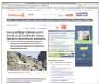
CHILE. “El Mercurio” on line.

“El Mercurio” de Chile en su versión on line (emol.cl) subrayó las medidas adoptadas por el Perú para garantizar la seguridad de los dignatarios que asisten a la cumbre ALC-UE. Destacó el amplio despliegue policial.