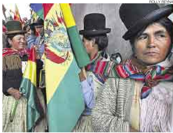
COLORIDO. Los trajes típicos de Bolivia llenaron de colores la tercera jornada de la Cumbre de los Pueblos.

Pero eso no fue todo. Se informó a la prensa que Evo Morales jugaría al lado, nada más y nada menos, que de Diego Armando Maradona. Pero los encargados de prensa de la Cumbre de los Pueblos no sabían dar razón ni de la hora ni del vuelo en el cual Maradona llegaría a Lima. A pocas horas del inicio del partido, trascendió que el astro del fútbol había perdido el vuelo de Roma a Lima.