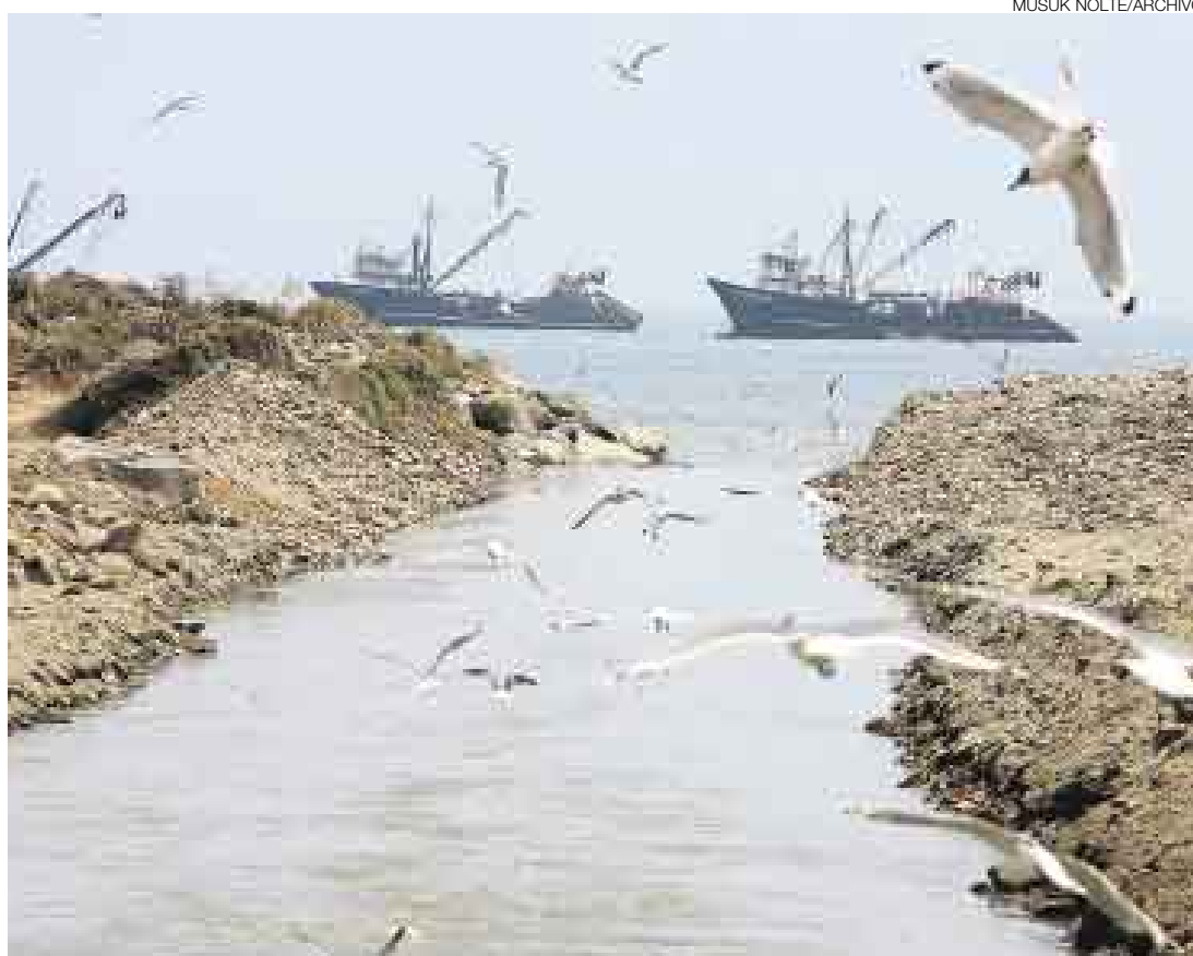
DAÑO AMBIENTAL. La Dirección de Ecología y Medio Ambiente de Digesa ha impuesto a Sedapal una multa de 40 unidades impositivas tributarias, equivalente a S/. 140.000, por abrir el Interceptor Norte.

La comisión, que también integran el Conam (luego lo hará el Ministerio del Medio Ambiente), Ministerio de Vivienda, Sedapal, la Comisión Ambiental Regional y la Municipalidad del Callao y Ventanilla, se reúne este