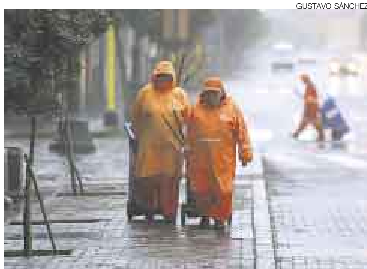
¡ABRÍGUESE! El brusco descenso de la temperatura es usual durante el otoño. Lloviznas mañaneras, como las de ayer, continuarán unos días más.

La llovizna que cayó ayer sobre la capital no estuvo sola. Una densa neblina cubrió gran parte de los distritos costeros, aunque también afectó La Molina, donde los termómetros descendieron hasta 13,5 °C, mientras la sensación térmica