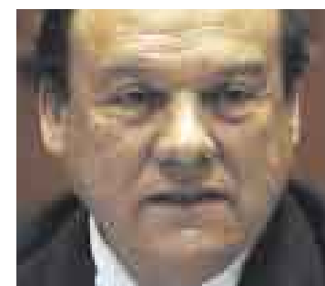
ESPERADO. Luis Alva Castro.

Este lunes corresponderá a la Mesa Directiva del Congreso y los voceros de las seis bancadas parlamentarias definir la hora y fecha de la esperada presentación del ministro del Interior, Luis Alva Castro, en el Parlamento, con la finalidad de que aclare la muerte de dos campesinos ayacuchanos durante el paro agrario de febrero.