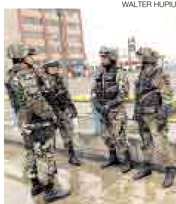
LISTOS. Fuerzas de Intervención Rápida (FIR) sobre la Av. Javier Prado.

Un impresionante despliegue policial, que incluyó el cierre del tránsito vehicular en la vía expresa de Javier Prado, así como la movilización de un helicóptero en esa zona y un pelotón de las Fuerzas de Intervención Rápida (FIR) de la Dirección de Operaciones Especiales (Diroes) de la Policía Nacional, caracterizó la jornada de ayer en los alrededores del Museo de la Nación, sede que reunió a los participantes de la V Cumbre de Jefes de Estado y de Gobierno de América Latina, el Caribe y la Unión Europea.