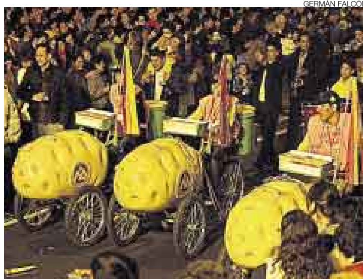
LA VEDETTE. Los mirafloresinos y quienes asistieron a ese distrito disfrutaron de un pasacalle en el que la papa fue la figura.

A las nueve de la noche empezó el curso central encabezado por un inmenso globo con forma de papa, una obra concebida por el español Anthony Miralda. El tubérculo se convirtió a partir de ese momento en la es-