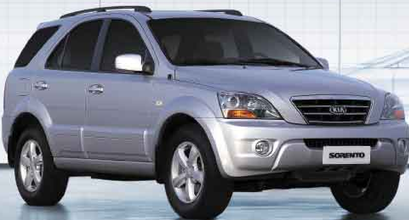
Foto con accesorios opcionales. Garantía 3 años o 100,000 Kms. lo que ocurra primero. Precio no aplicable a Panderó S.A. EAF.

APROVECHA LA PROMOCIÓN KIA EN MAYO... LLÉVATE UNA SORENTO CON UN SUPER DESCUENTO!!!