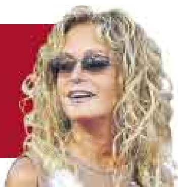
FARRAH FAWCETT [SOBRE MUJER QUE ROBÓ SU HISTORIA MÉDICA]

“Creo que Lwanda Jackson es culpable por filtrar la información. Ella es solo el peón de un sistema hospitalario que vulnera la privacidad de sus pacientes”