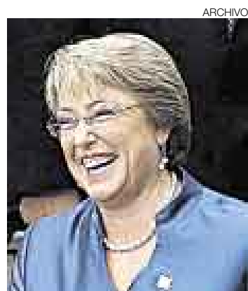
ASEQUIBLE. Bachelet dialogó con su homólogo Alan García.

No conversaron en una reunión bilateral propiamente dicha. Fue durante el almuerzo de mandatarios de la V Cumbre de América Latina, el Caribe y la Unión Europea, que duró una hora y veinte minutos, tiempo suficiente para que el presidente Alan García y su homóloga chilena, Michelle Bachelet, pudieran empezar a calentar una relación que se enfrió tras la demanda presentada en enero último por el Perú ante la Corte de La Haya por el difereando marítimo.