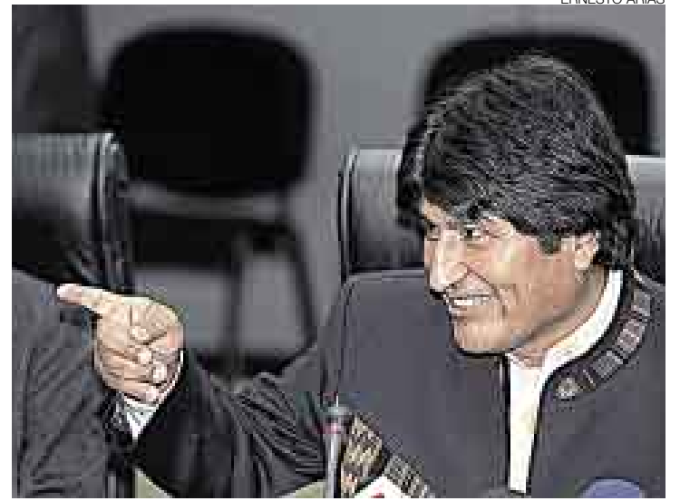
APURADO. Morales se despidió ayer del Perú tras desorganizada conferencia de prensa. En Bolivia lo esperaban para poner orden.

Consultado por este Diario sobre si consideraba que el MRTA era un grupo terrorista, Morales apenas respondió con una sonrisa que dejó para la interpretación. ■