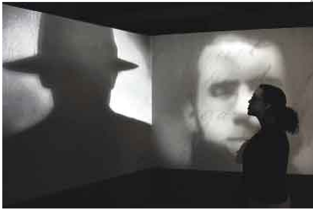
SOMBRAS NADA MÁS. Museo de los Docklands de Londres alberga lúgubre muestra dedicada al famoso asesino.

Las víctimas, que fueron horriblemente mutiladas, compartían