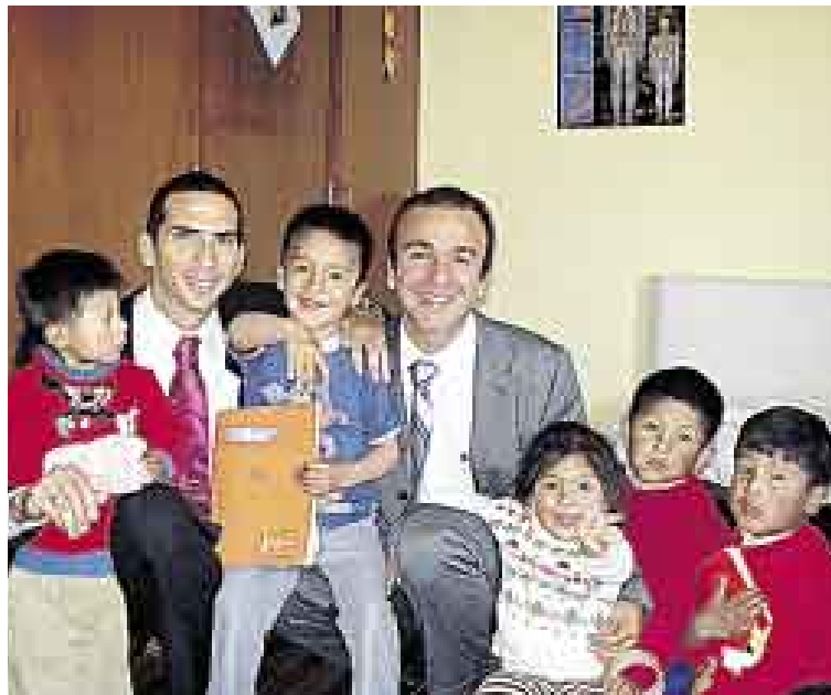
HUANCAYO. DIRECTIVOS DE INTRALOT DEPARTIERON CON NIÑOS DE BENEFICENCIA.

• No sabemos si la causa de todo fue tan solo huir del caos vehicular, lo cierto es que ellos dejaron atrás sus bien acondicionadas oficinas y partieron rumbo a Huancayo, a los centros que la beneficencia de esa ciudad atiende y, por unas horas, se olvidaron de calles cerradas y embotellamientos y, más bien, disfrutaron de los mimos de los niños que son atendidos gracias a los ingresos que a Intralot le genera el que tanto peruano se espere en que sea la lotería la que le cambie la vida.