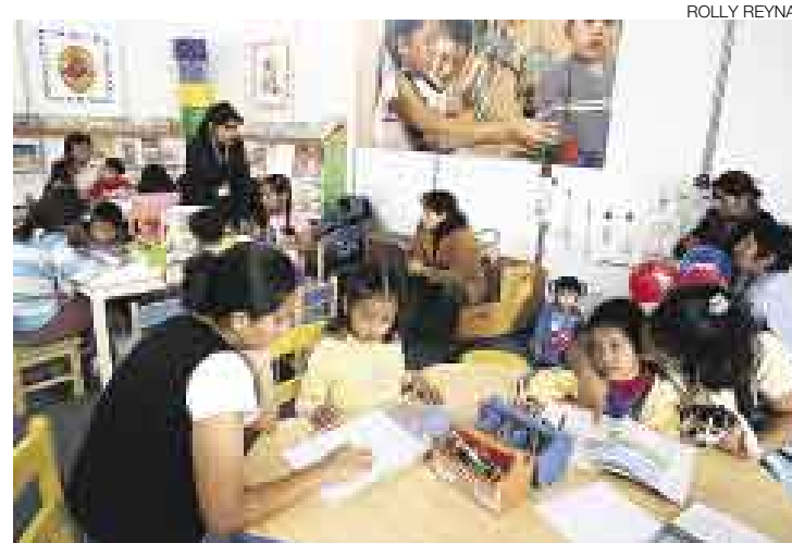
A LEER. Muchos niños de los distritos del cono norte sacaron provecho de esta iniciativa de la Cámara Peruana del Libro.