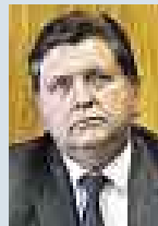
ALAN GARCÍA, PRESIDENTE DE LA REPÚBLICA.

Las negociaciones de la CAN con la UE corren riesgo de entraparse por dos corrientes antagónicas en el lado andino. Alemania reconoció esto y dio apoyo a vías rápidas para el Perú y Colombia.