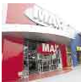
CONVIVENCIA. ESTRATÉGICA UNIÓN EN PROYECTOS.

Si algo parece haber puesto en evidencia los proyectos comerciales de Mall Aventura Plaza es que dos de sus futuros inquilinos, Ripley y Max , convivirán en futuros proyectos comerciales. Así, las tiendas de la familia Calderón estarán juntas en los proyectos previstos para los Aventura Plaza de Arequipa y Santa Anita , que deben inaugurarse en el 2009. Con ello, ambas deberán concentrarse en reforzar su posicionamiento: Ripley enfocada en moda y valor; y Max más orientada a precios bajos y descuentos.