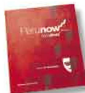
NO SE VE. SE REQUIERE INFORMACIÓN MÁS DETALLADA.

La semana pasada Suez Energy dijo que tiene la capacidad y el interés de participar en la construcción del gasoducto andino si es que el Gobierno lo declara prioritario. Esta afirmación iría más allá de una simple declaración, pues fuentes del sector energético indicaron que Suez estaría en conversaciones con Kuntur para ir juntos en ese proyecto. Así, tras tener proyectos que competían – Suez quería construir un ducto al sur por la costa y Kuntur por la sierra– ahora se unirían. Pero estos no serían los únicos interesados en participar en el proyecto para llevar gas natural por los Andes. La semana pasada la estadounidense Energy Transfer solicitó formalmente la concesión para construir también el gasoducto andino. Ante ello, todo apunta a que se convocaría a un licitación para elegir a la empresa que se encargará del proyecto.