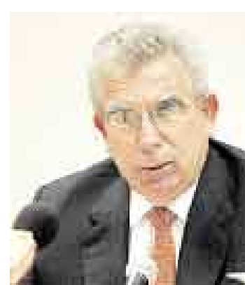
MORALES. Celebró la creación del Ministerio del Ambiente.

Asimismo, trajo a colación que Yanacocha aún mantenía proyectos que de ponerse de acuerdo con la población se po-