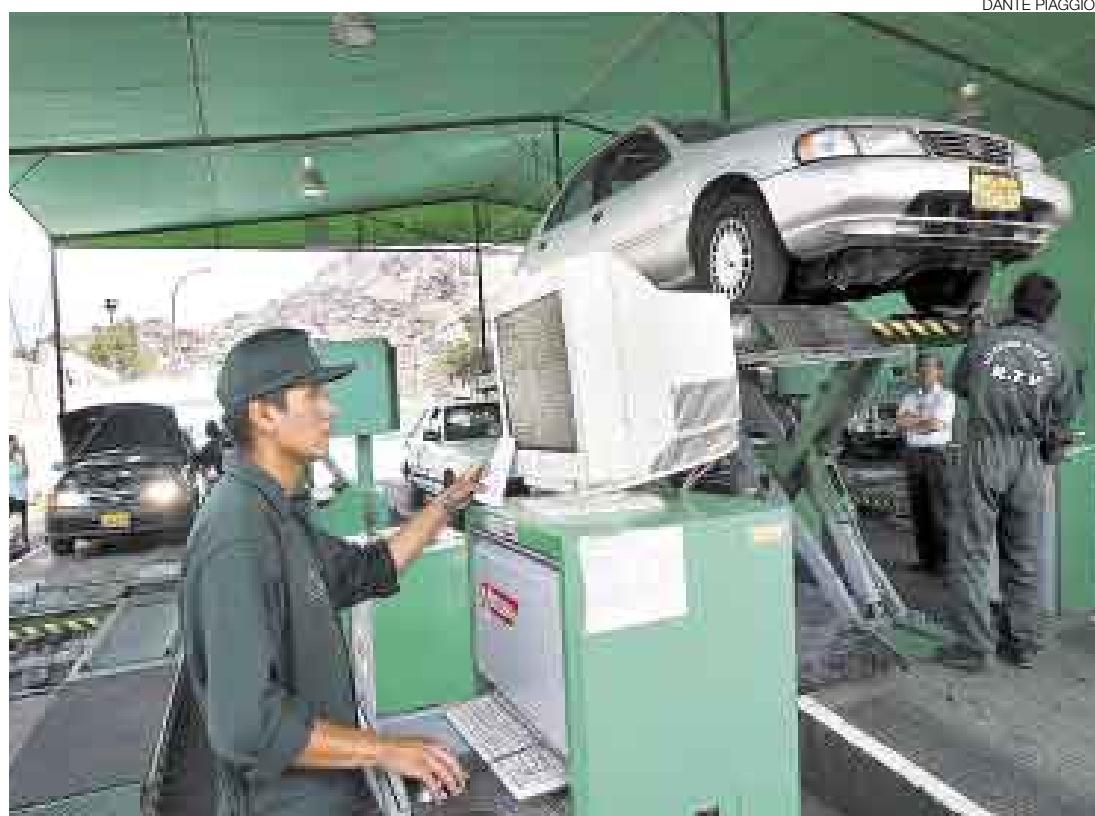
SIN FECHA. La reapertura de las plantas de revisiones técnicas vehiculares de Lidercon sigue en suspenso.

“No nos sentaremos a dialogar con los representantes de la Municipalidad de Lima ni con ninguna comisión de alto nivel mientras las autoridades municipales no cumplan la resolución cautelar arbitral, que dispone reanudar las revisiones técnicas vehiculares en Lima”, enfatizó el representante de la compañía de capi-