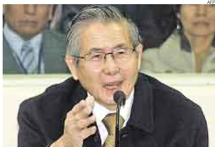
AFFECTADO. Alberto Fujimori será examinado por el Instituto de Medicina Legal. Su hija Keiko pidió que se le cambie su régimen penitenciario.

“Mañana (hoy) puede acudir a su audiencia sin problemas”, sostuvo, no sin antes precisar que es-