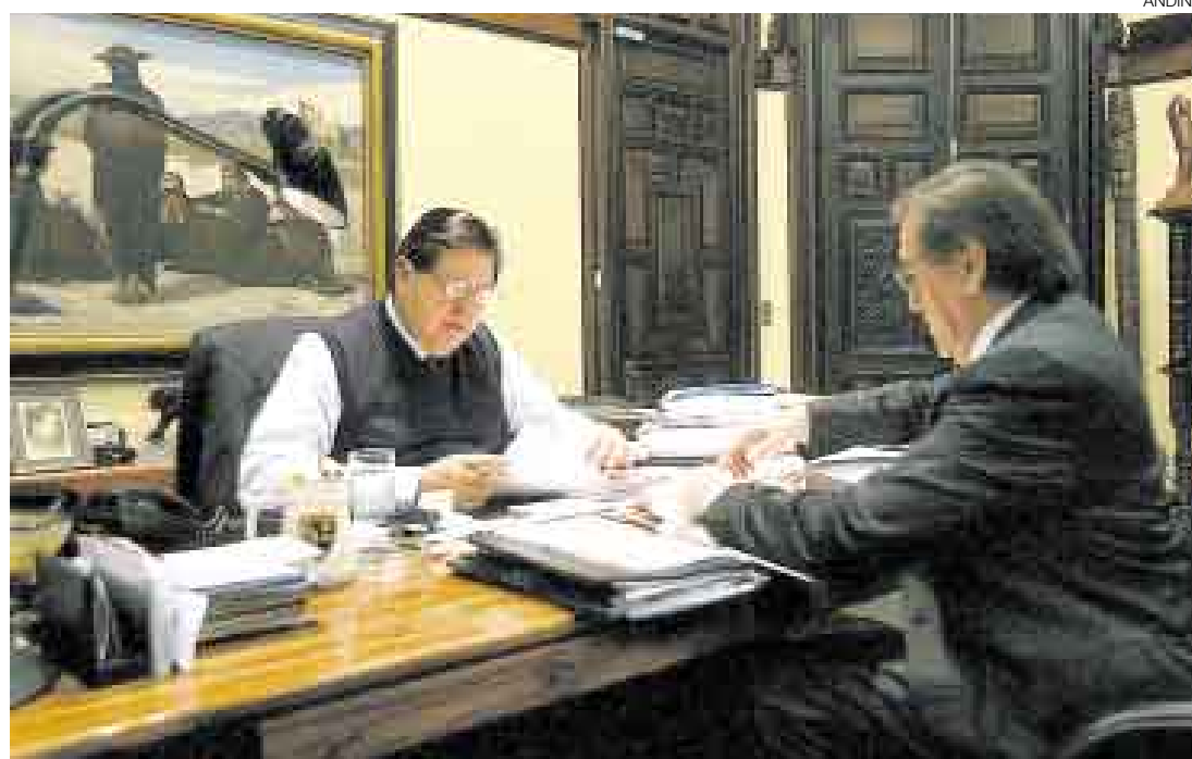
¿EVALUANDO CAMBIOS? Al cumplirse el primer tercio del gobierno, todo indica que habrá una perspectiva distinta. El presidente Alan García y el primer ministro Jorge del Castillo se abocaron a ello ayer temprano.

La idea de esta segunda fase se traduciría en más recursos orien-