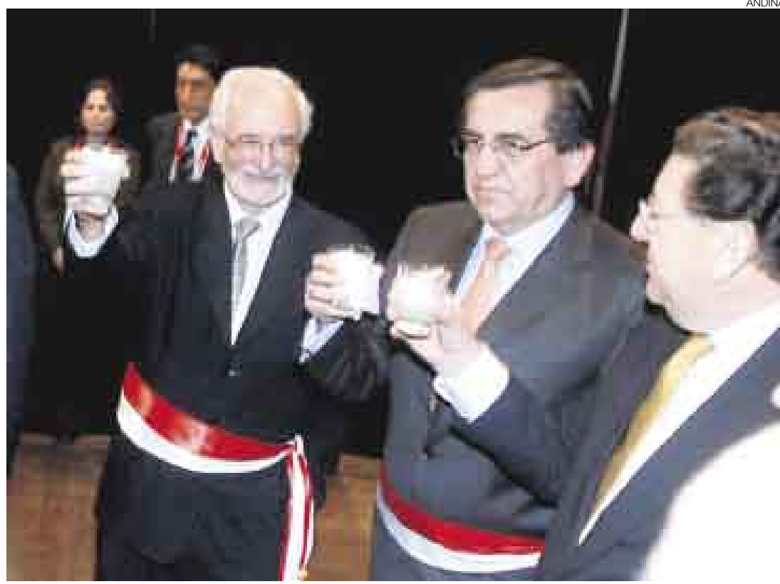
BRINDIS Y LUCHA. El nuevo ministro del Ambiente, Antonio Brack, no ha perdido tiempo en demandar la gestión del agua. Se espera que este tema sea el plato de fondo en el Consejo de Ministros que se realizará hoy.

Pese al gran malestar que habría generado esa postura, el titular de Agricultura, Ismael Bena-