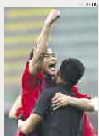
ADIÓS. Cafú defendió a la Roma y al AC Milán en Italia.

Roma [EFE]. El lateral brasileño Marcos Cafú, que el próximo junio finaliza su contrato con el AC Milán y dejará el 'Calcio' tras cinco temporadas en el club 'rossonero' y seis en la Roma, aseguró ayer que en Italia ha dado "mucho más" de lo que ha aprendido. El brasileño aseguró que cuando llegó a Italia ya era "campeón del Mundo con el Sao Paulo y con Brasil".