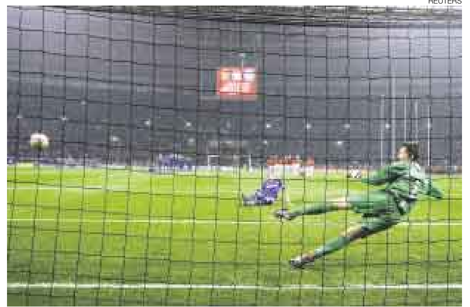
BLOOPER. Terry tenía la Champions para Chelsea pero resbala. "Voy a reponerme", dijo.