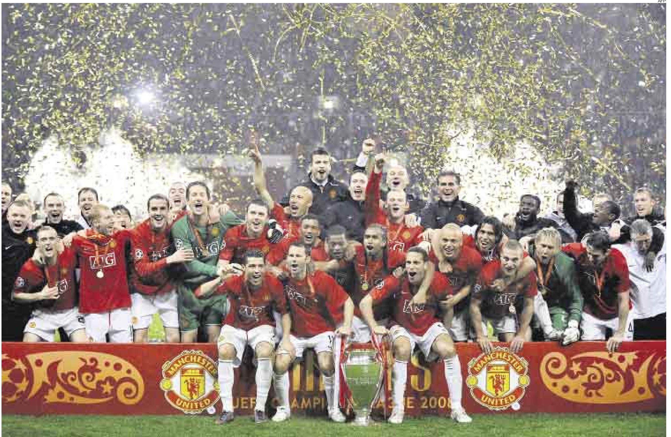
LA BANDA ROJA. Liderados por Ronaldo en la cancha y Ferguson desde el banco, Manchester ganó a Chelsea por penales y ratificó su hegemonía en Europa. Fue, sin duda, el equipo que mejor jugó en el torneo.