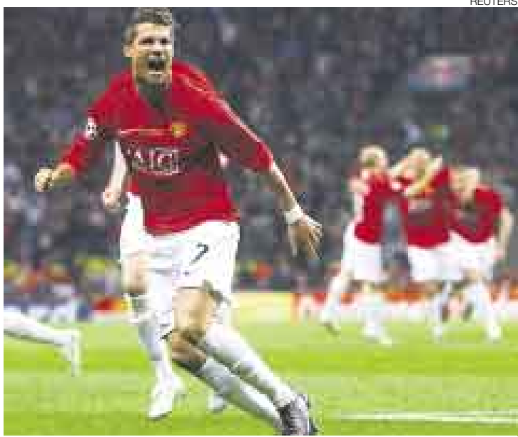
1-0. Ronaldo golpea en el comienzo y ratifica su condición de crack.