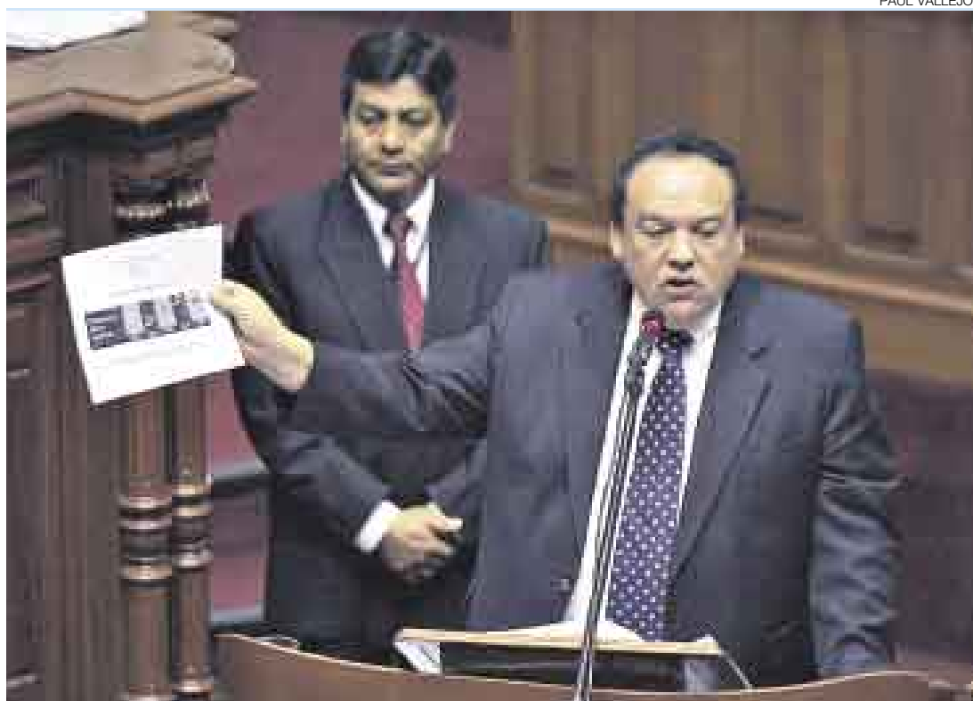
FUERON 47 MINUTOS. El ministro del Interior, Luis Alva Castro, sostuvo que nunca ha mentado al Congreso.

Por mandato reglamentario se requieren 32 firmas para la presentación de una moción de censura y 61 adhesiones para aprobarla en una sesión plenaria. Sumando a los integrantes de UPP y del PNP, llegan a 42 legisladores, según calculó Luizar,