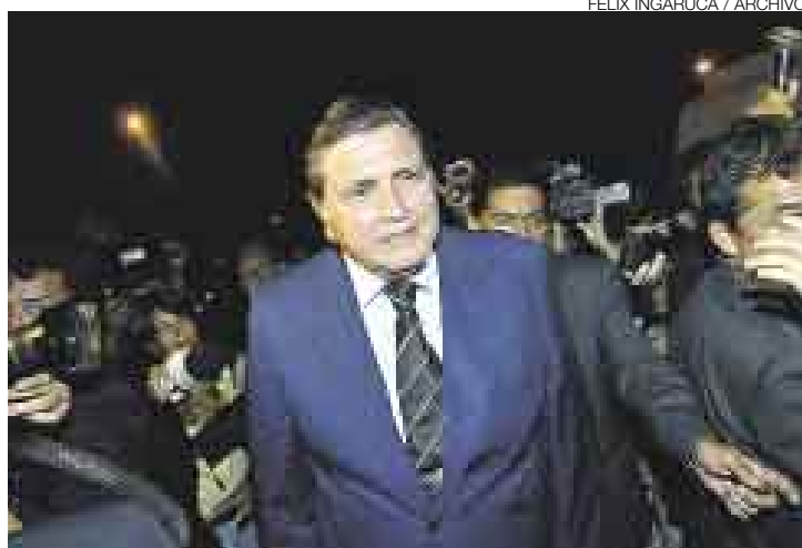
¿HABRÁ CAMBIO DE MINISTROS? El jefe del Estado volvió a guardar silencio ayer respecto de posibles cambios en el Gabinete Ministerial.

También criticó que Juntos se haya “estacionado” un poco en la verificación de objetivos. “Hay que llegar más directamente,