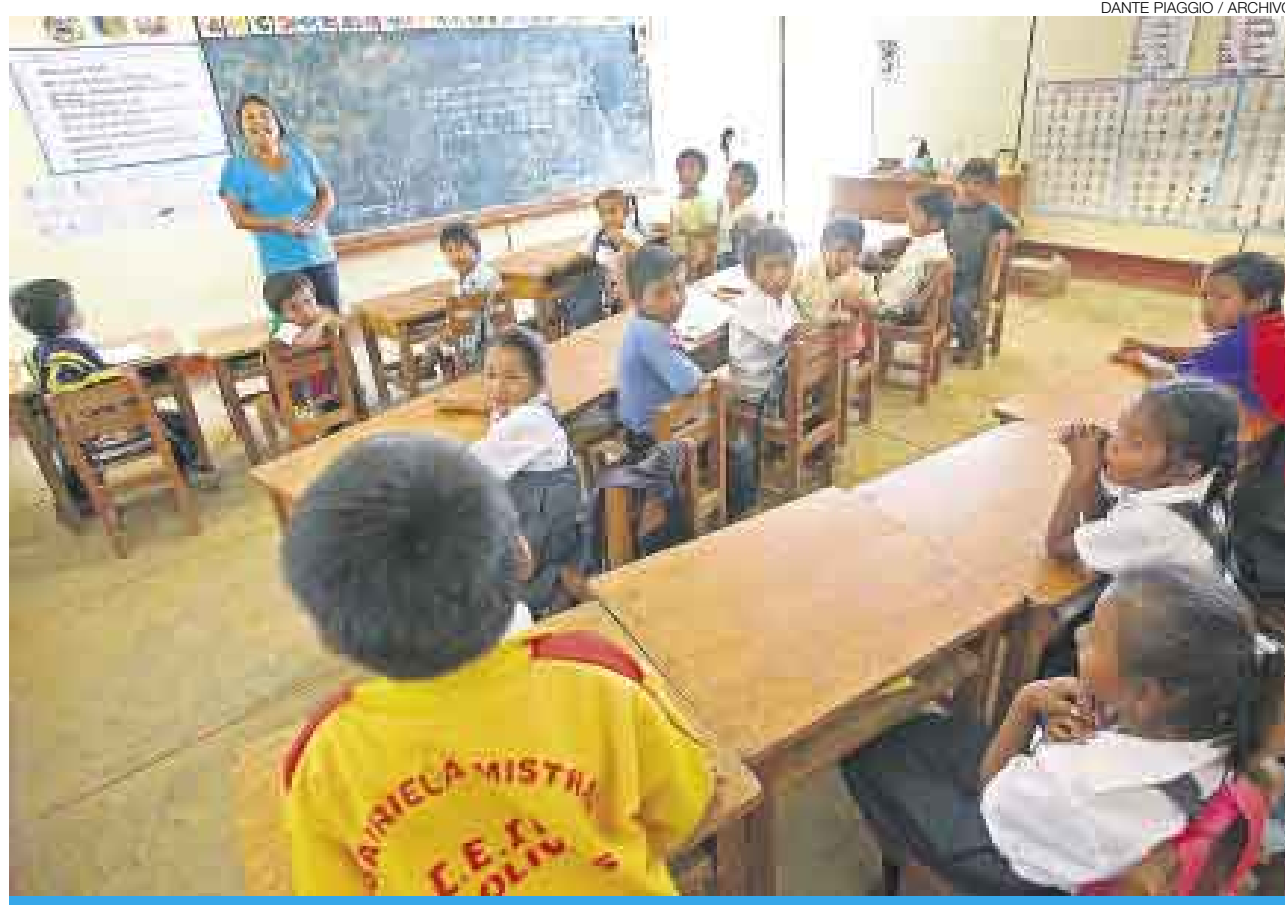
DANTE PIAGGIO / ARCHIVO