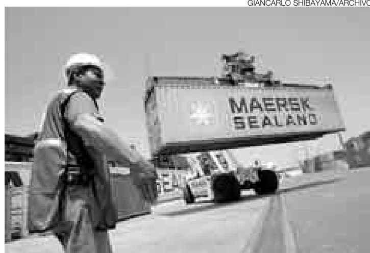
PUERTOS. Como parte de los compromisos asumidos por el Perú con el TLC, es necesario agilizar todo el proceso aduanero.

Explicó que este paquete de 23 normas publicadas aún no corresponde a los compromisos estrictos asumidos con Estados Unidos, sino a la agenda interna para aprovechar el acuerdo