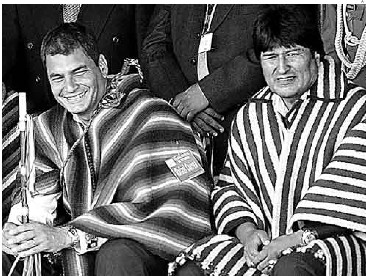
ENTRAMPAMIENTO. Presidentes de Ecuador (Rafael Correa) y Bolivia (Evo Morales). Perú espera que ambos países apoyen su reconsideración ante la CAN.

Al ministro se le preguntó si esta situación puede generar un punto de quiebre con la CAN, es decir que el Perú pudiera optar por retirarse de este bloque regional para poder implementar el TLC con Estados Unidos.