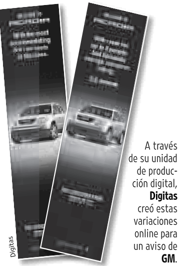
A través de su unidad de producción digital, Digitas creó estas variaciones online para un aviso de GM.

Una agencia que se está beneficiando es avVenta Worldwide, que tiene 415 empleados en San José, Costa Rica; Kiev, Ucrania; y Londres, así como en Charleston, Carolina del Sur. Desde que empezó en 2005, avVenta ha construido su negocio aceptando trabajos de producción de anuncios de Internet para algunas de las compañías más grandes del mundo, entre ellas General Motors Corp., Microsoft Corp. y Bank of America Corp., a precios entre 20% y 50% más bajos que los que cobran las agencias en EE.UU., dicen los ejecutivos publicitarios.