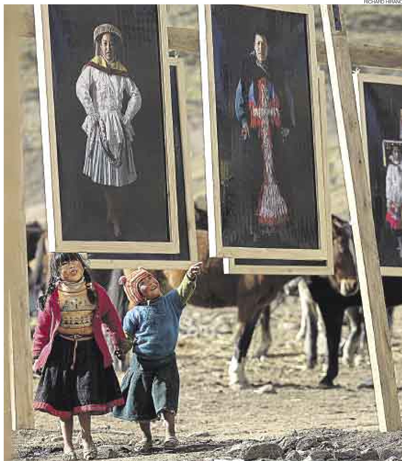
AL AIRE LIBRE. Cuarenta retratos de bailarines, campesinos, autoridades y peregrinos fueron apreciados por fieles de todas las edades.