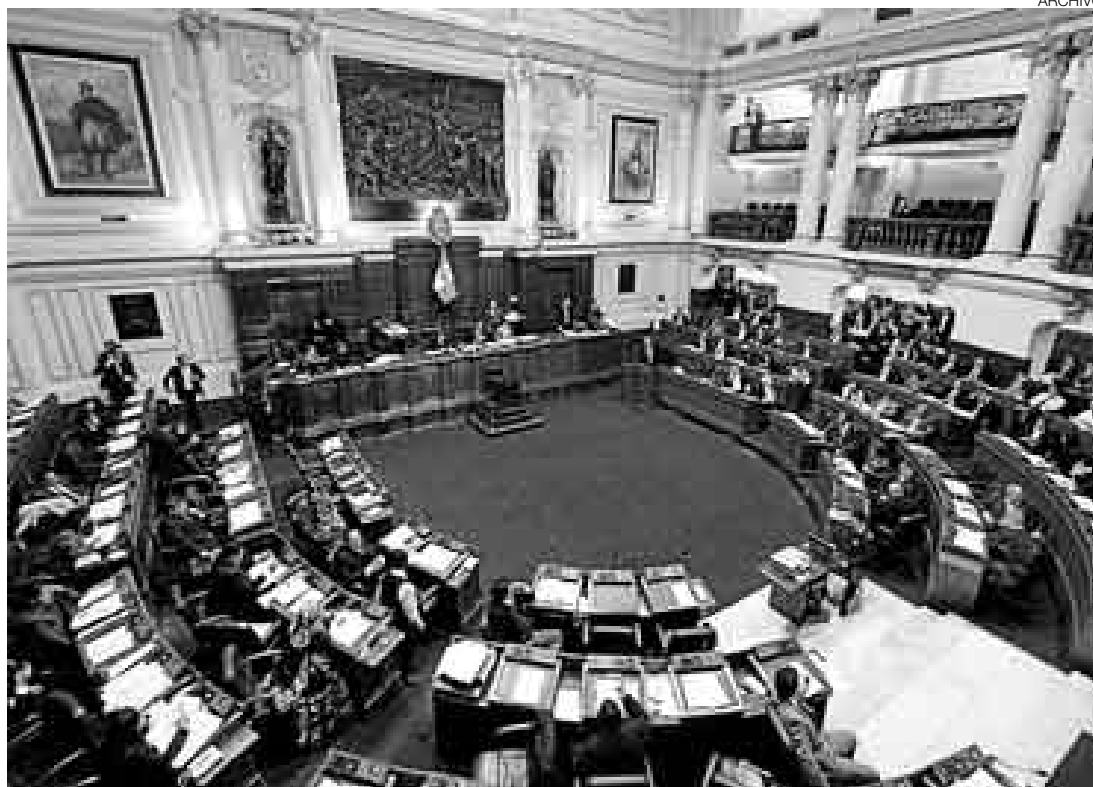
ASISTENCIA. La inamovilidad permitirá asegurar que haya suficiente quórum para votar las reformas.

“Yo espero que esta exhortación dé buen resultado y que no haya ausencias, que al final