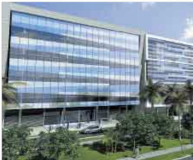
Edificio A1-Planta Típica de 1,030m2

Sólido, espacioso y elegante. Última generación corporativa en Chacarilla Surco.