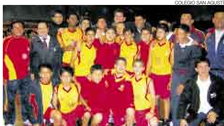
COLEGIO SAN AGUSTÍN

El desempeño de ambos había sido parejo. Y volvió a serlo durante este encuentro de fondo. Si bien San Agustín sacó 20 puntos de ventaja en los dos primeros cuartos, en el tercero Juan XXIII alcanzó, tras una arrolladora seguidilla de canastas, 40 puntos. San Agustín, que había mantenido sus 42 puntos, retomó la ofensiva hacia la mitad del último cuarto: cuatro canastas dobles contra un tiro libre acertado del equipo rival